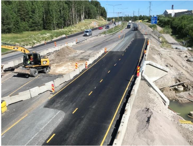
Kuva 1. Sillan U-1468 korjaustyöt aloitettu ja uudet liikennejärjestelyt otettu käyttöön.