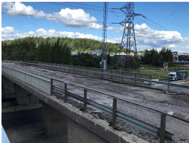
Kuva 3. Sillan S112 purkutyöt aloitettu vanhan päällysteen poistolla.