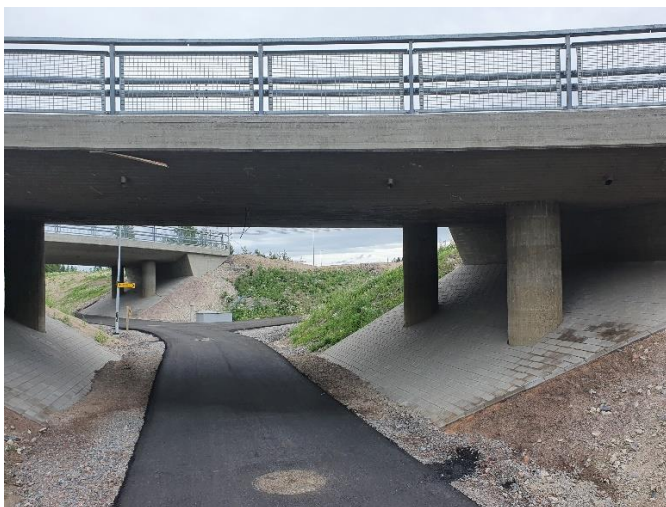
Kuva 5. Kevyen liikenteen väylät J1, J2 ja K1J avattu liikenteelle.