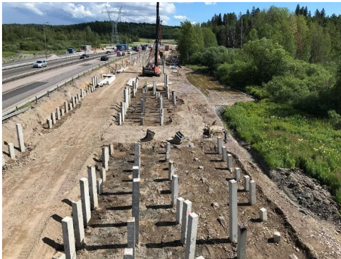
Kuva 4. S104 paalulaattojen paalutus käynnissä.

Uudet suunnitelmat Nuolitian kohdan HSY:n vesihuoltotöille on saatu ja hyväksytty. Töitä alueella on päästy jatkamaan. Hankeosan muut työt ovat valmistuneet.