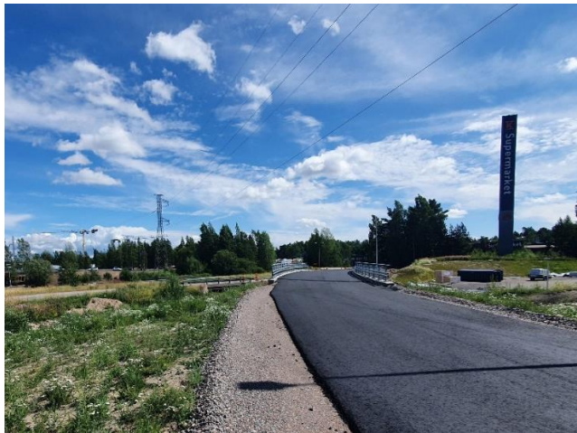
Kuva 2. Silta S108 asfaltoitu.