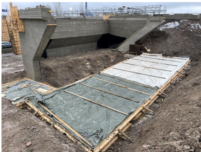
Kuva 3. Sillan S112 maatuen T6 lisälaatat valettu.