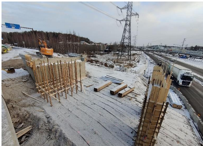
Kuva 2. Sillan S112 pelkkapeti valmistunut tukien T5 ja T6 kohdalla. Telineolpituksen rakentamista aloitettu.