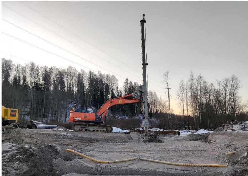
Kuva 4. Pilaristabilointi käynnissä väylällä K3.

Vantaankoski-Pakkalan työt ovat hankkeen osalta valmistuneet, mutta HSY jatkaa alueen vesihuollon korjaustöitä.