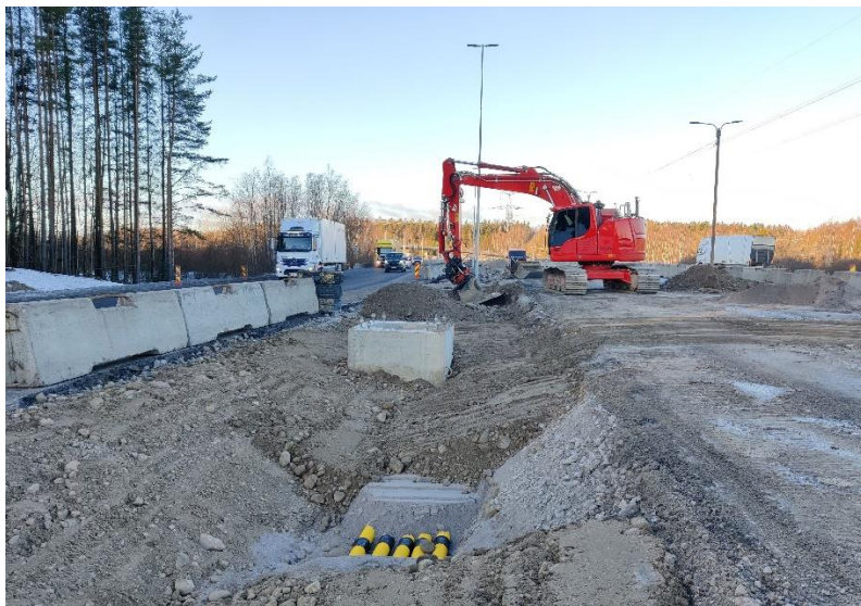
Kuva 5. Portaaliperustuksen ja kaapeliputkitusten asennus käynnissä.