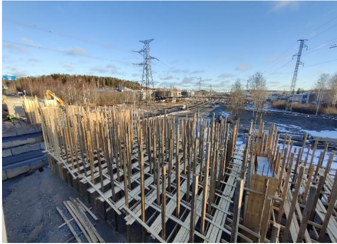
Kuva 1. Sillan S112 tukien T1-T3 telineen rakentaminen käynnissä.