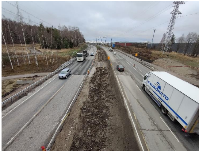
Kuva 2. Yleiskuva sillalta S106 itään. Sillan S107 kohdalla kiertotiejärjestelyt purettu.