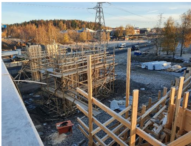
Kuva 3. Sillan S112 tukipilareiden rakentaminen käynnissä.