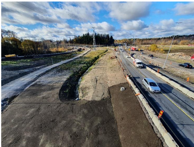
Kuva 5. Yleiskuva sillalta S106 länteen.