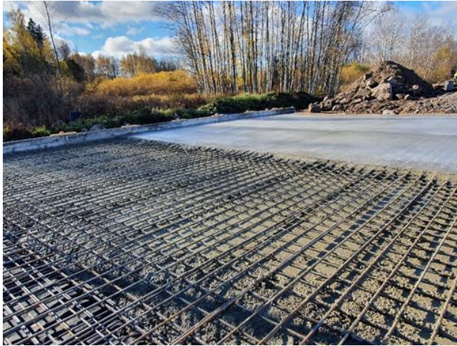
Kuva 1. S104 paalulaatan betonointi käynnissä.