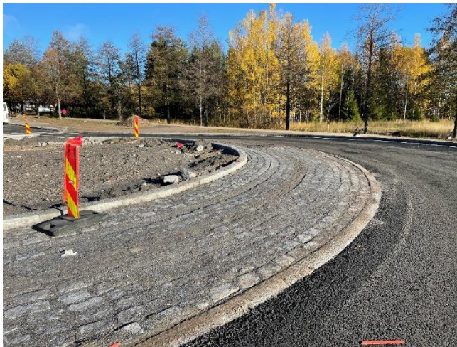
Kuva 4. Väylän K2 kiertoliittymässä kiveystyöt käynnissä.

HSY:n vesihuollon rakennustyöt ovat käynnissä Nuolitien kohdalla. Kevyen liikenteen väylä on avattu liikenteelle murskepintaisena viikolla 41. Hankeosan muut työt ovat valmistuneet.