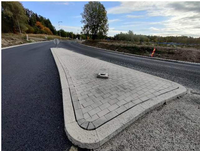
Kuva 4. Asfaltointia on jatkettu väylällä K1. Kivityöt käynnissä.

HSY:n vesihuollon rakennustyöt ovat käynnissä Nuolitien kohdalla. Hankeosan muut työt ovat valmistuneet.