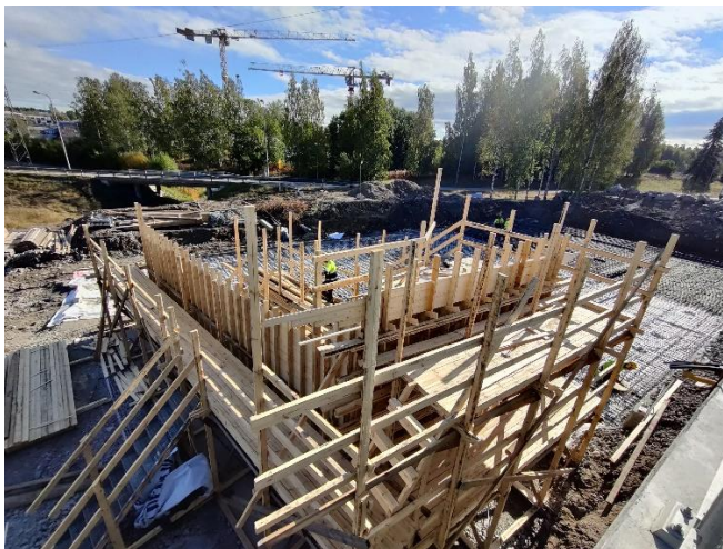
Kuva 3. Sillan S112 tuen T1 teline- ja muottityöt käynnissä.