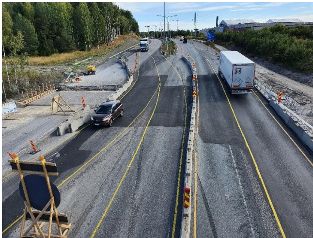
Kuva 2. Yleiskuva sillalta S106 itään. Sillan S107 korjaustyöt näkyvät kuvassa vasemmalla.