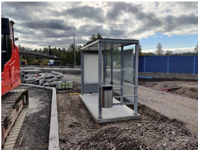
Kuva 5. Pysäkkikatosten asennus käynnissä väylällä K2.