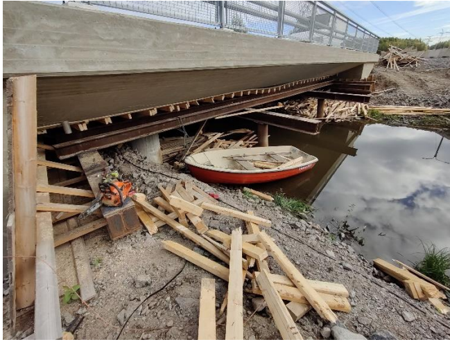
Kuva 1. Sillan S105 muotin purku käynnissä sillan alapuolella.