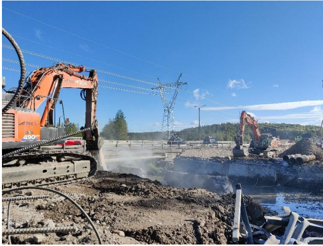
Kuva 1. Sillan S104 purkutyöt käynnissä.