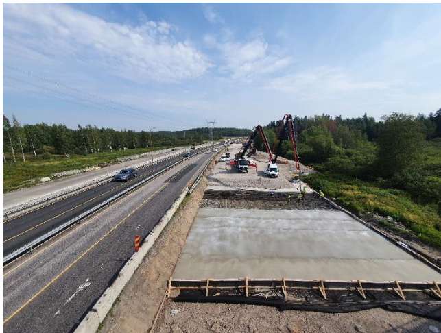
Kuva 4. S104 paalulaattojen rakentaminen käynnissä Kehä III:n eteläpuolella.

HSY:n vesihuollon rakennustyöt ovat käynnissä Nuolitien kohdalla. Hankeosan muut työt ovat valmistuneet.