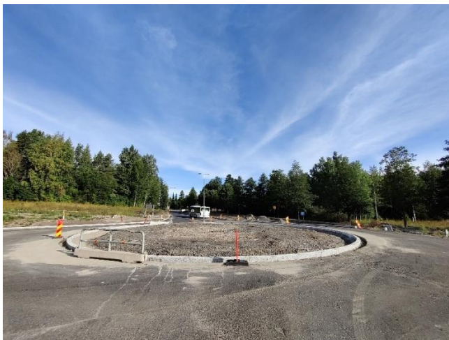
Kuva 5. Reunakivitoit käynnissä väylän K2 kiertoliittymässä.