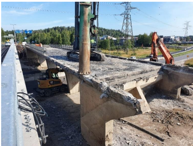
Kuva 3. Sillan S112 purkutyöt käynnissä.