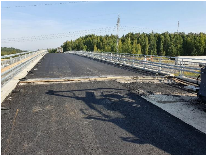
Kuva 2. Sillan S106 ensimmäinen asfalttikerros levitetty.