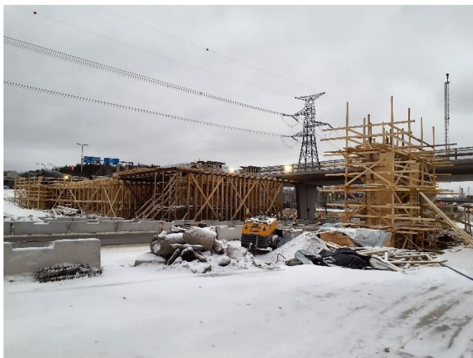
Kuva 3. Sillan S111 tukien rakentaminen ja kannen muuttotyöt käynnissä.