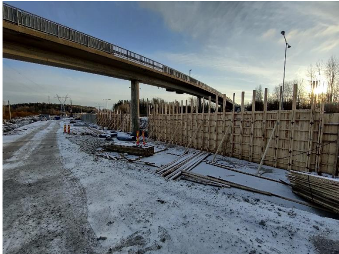
Kuva 4. Askiston tukimuurin rakentaminen käynnissä väylällä K2.

Nuolitien kohdalla vesihuollon rakentaminen on käynnissä. Hankeosan muut työt ovat valmistuneet.