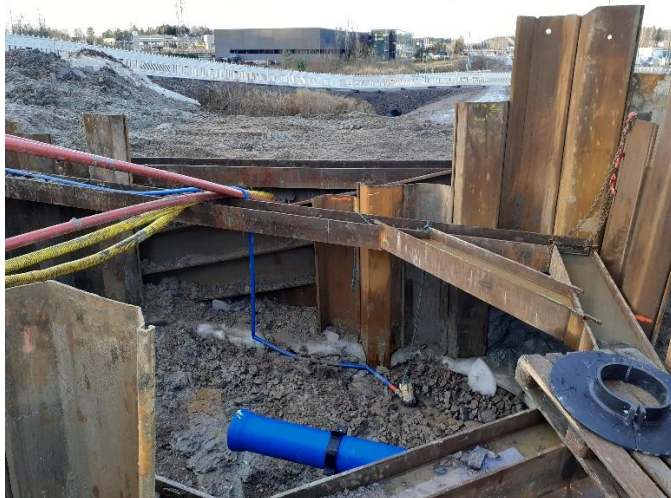
Kuva 5. Vantaankoski-Pakkalassa vesihuollon alitusporaus ja putken sujutus suoritettu.