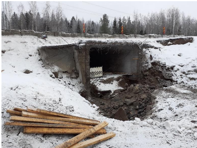
Kuva 2. Sillan S107 vanhat siipimuurit purettu.