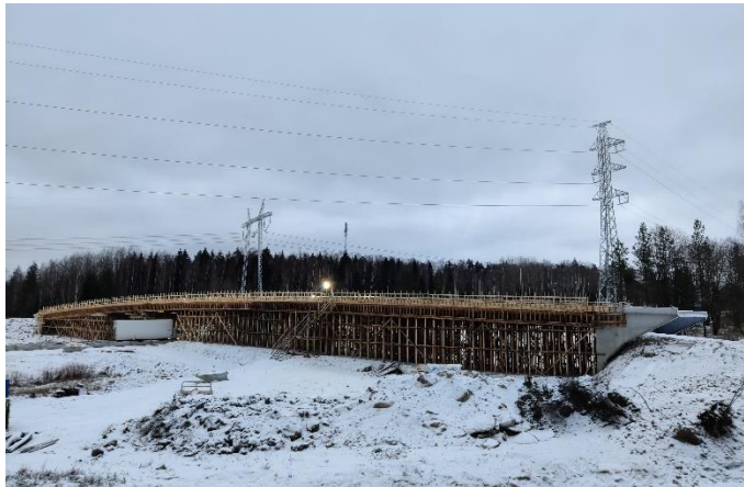
Kuva 1. Sillan S106 telineet ja muotit valmistuneet.