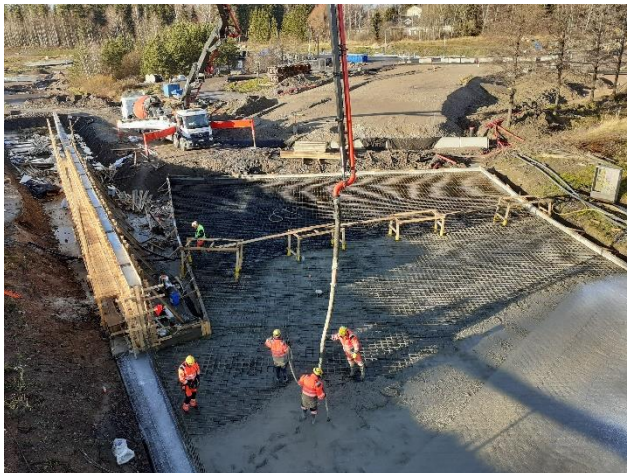
Kuva 5. Askistossa rampin E1R3 / väylän K2 kohdalla paalulaatan valu ja tukimuurin rakentaminen käynnissä.