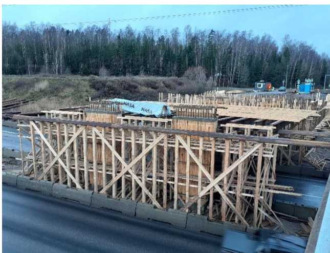
Kuva 3. Sillan S111 teline- ja muottityöt käynnissä liikenneaukon kohdalla.