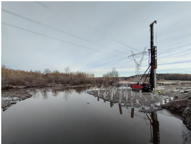
Kuva 4. Paalutus käynnissä Askistossa väylällä K2.

Bussipysäkit ja kevyen liikenteen väylä tukimuurin vierestä on päällystetty. Kaidetyöt ja ajoratamaalaukset ovat valmistuneet. Nuolitien kohdalla vesihuollon rakentaminen on käynnissä.