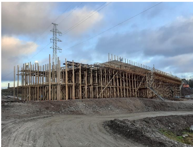
Kuva 2. Sillan S106 teline- ja muottityöt käynnissä.