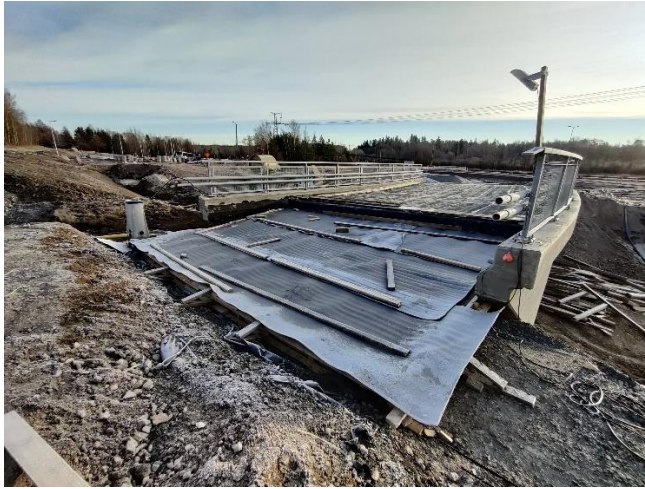
Kuva 1. Sillan S102 siirtymälaatta valettu.