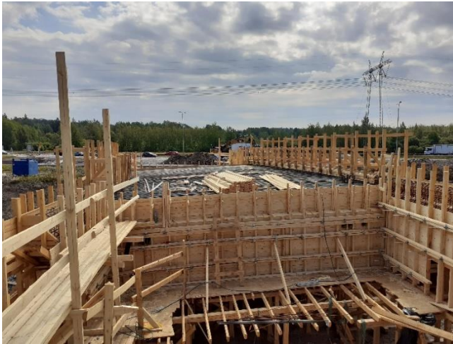
Kuva 1. Sillan S102 raudoituksen teko käynnissä.