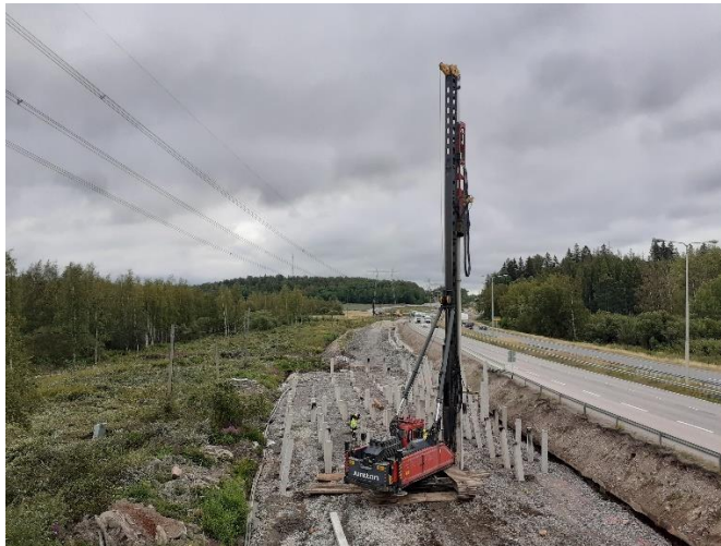
Kuva 4. Askistossa paalutus käynnissä.

Käynnissä maaleikkaus- ja päällystystöitä sekä vesihuollon rakentamista. Kevyen liikenteen väyliä rakennetaan sekä valaisinjalustoja asennetaan. Painumakorjaukset käynnissä. Lisäkaistojen maaleikkaus ja tien rakennekerrosten teko käynnissä koko hankeosa-alueella.