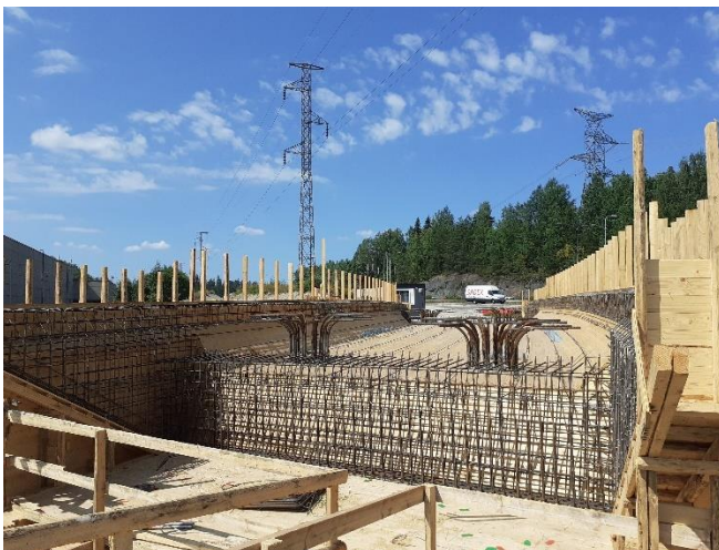
Kuva 3. Sillan S108 raudoitustyöt käynnissä.