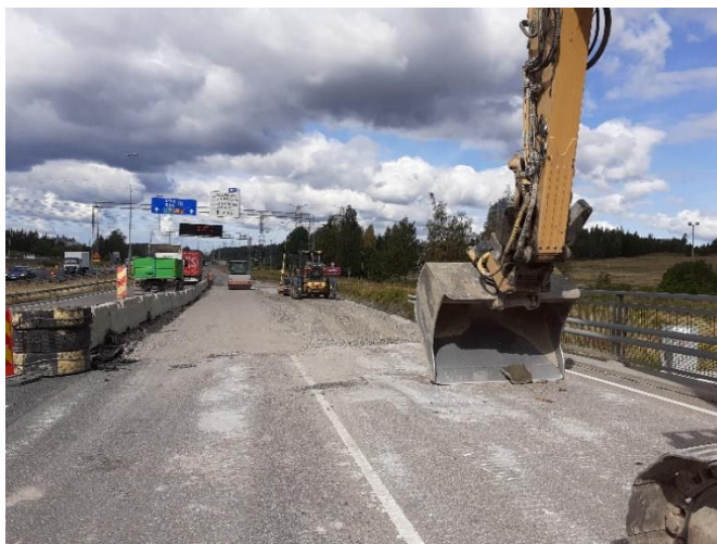
Kuva 5. Vantaankoski-Pakkalassa painumakorjaukset länteen päin käynnissä. Itäsuunnan kaistojen painumakorjaus valmistunut.