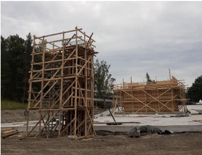
Kuva 2. Sillan S106 T5 ja T6 muotti- ja raudoitustyöt käynnissä.