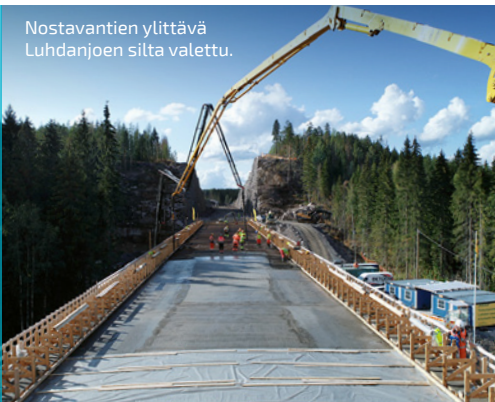
Nostavantien ylittävä Luhdanjoen silta valettu.

VIIKON ONNISTUMISET: Hankeosan pisin silta valettu.