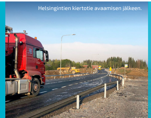
Helsingintien kiertotie avaamisen jälkeen.

VIIKON ONNISTUMISET: Helsingintien kiertotie käyttöön!