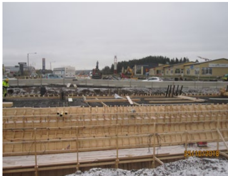
Aukeankadun alikulkukäytävä odottamassa valua.