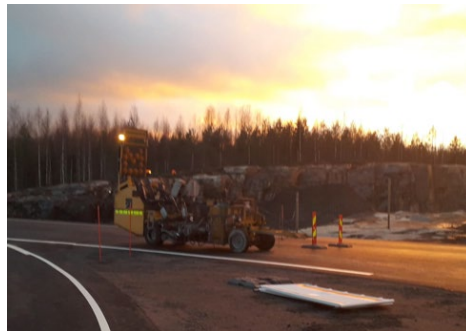
Kuvassa valmistellaan kiertotien käyttöönottoa Soramäessä.