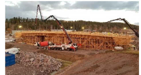
Ajokadun risteyssillan valu.