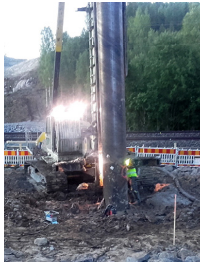
Kuvassa porapaalutus käynnissä.