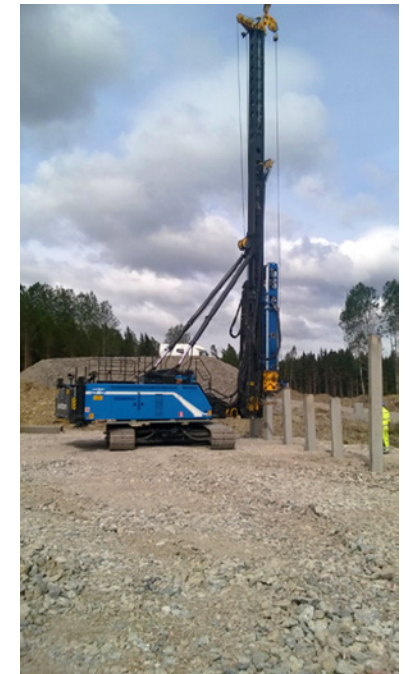
Paalutustyöt alkaneet Kujalassa.