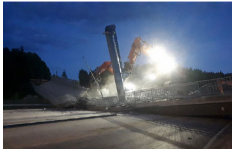
Launeen ylikulkusilta purettiin pääosin yöaikaan.