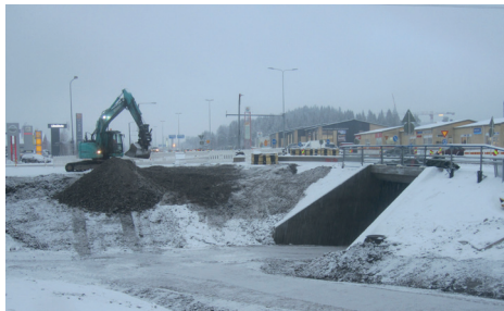
Aukeankadun alikulkukäytävä on nyt avattu.