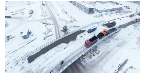
Ajokadun sillan päällystystyöt käynnissä.