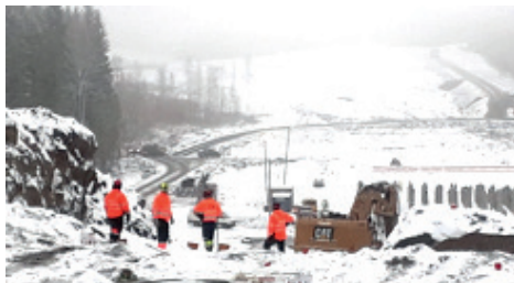
Tonttuja työmaalla? Ei, vaan louhijat räjäytyspuuhissa Takamaalla.