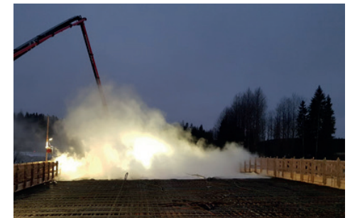
Valu käynnissä Huovilanmäen risteyssillalla