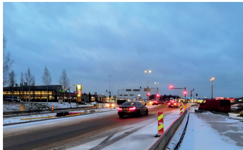
Renkomäen ABC:n liikennevaloristeyksen läpi etelään kulkee nyt kaksi kaistaa