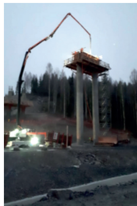
Kuvassa on käynnissä Vähäjoen sillan pilareiden valu