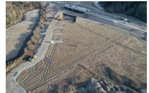
Uutta työmaatietä Launeella