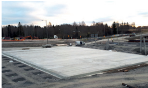
Kuvassa valettu paalulaatta Okeroisissa.