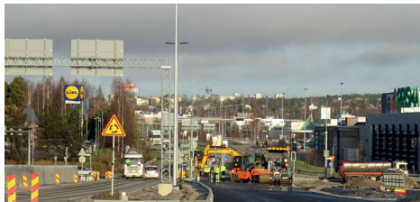
Uudenmaan päällystystöitä Apilakadun risteuksen luona