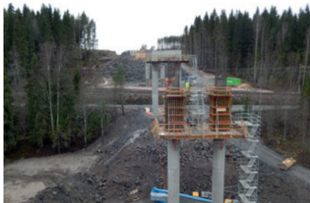
Kuvassa näkymää Vähäjoen sillan tukipilareista