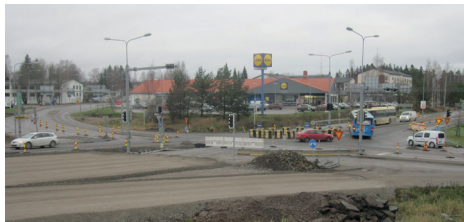
Uudenmaan ja Apilakadun työnaikainen kiertoliittymä sekä Uudenmaankadun kerrosrakenteita