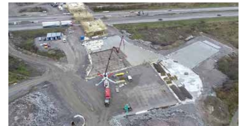
Paalulaatat rakentuvat Kujalassa.