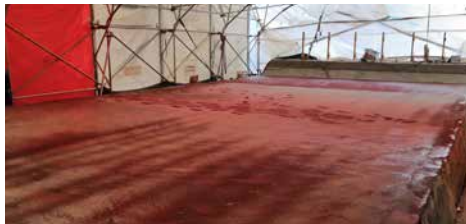
Kyöstilän alikulkukäytävän vesieristystyö.