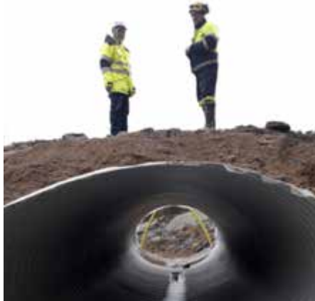
Kuvassa Asennettuna työnaikainen siltarumpu Takamaalle.