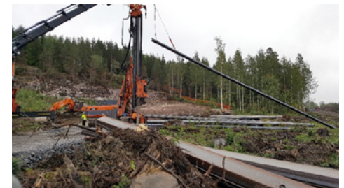
Pontituskone jatkaa työtään Liipolan tunnelin läntisellä suuaukolla