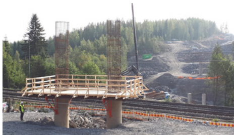
Kuvassa Letken oma "humppalava" eli pilareiden työtaso.