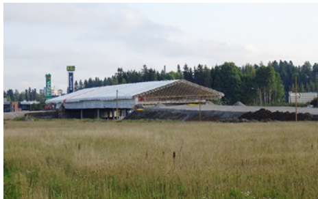
Launeen risteyssillan kohta