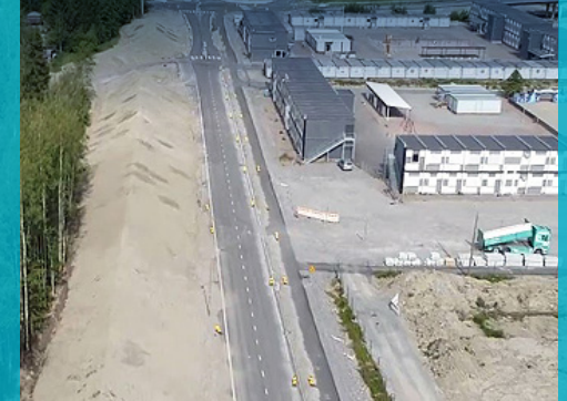
Kuvassa Orvokkitien valli.

Orvokkitien vallin rakentaminen sujuu hyvin.