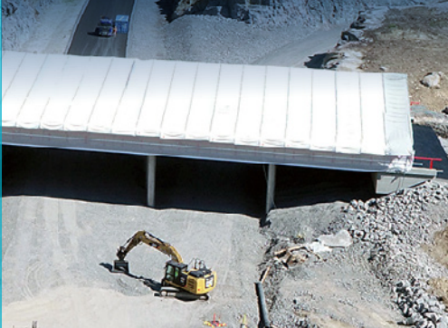
Telttailukesä kuumimmillaan Soramäessä.