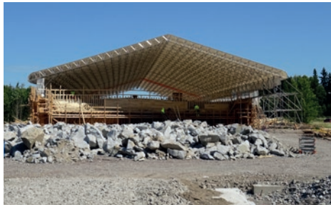
Launeen risteysillan sääsuoja valmistumassa.