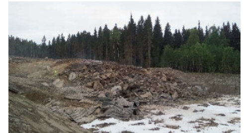
Ensimmäinen louhintaräjätys suoritettu Liipolan tunnelin itäpäässä.