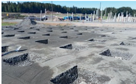
Kuvassa sienilaatan pohjarakenne.