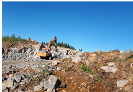
Kuvassa kivien rikotus Tikkakalliontien läheisyydessä.