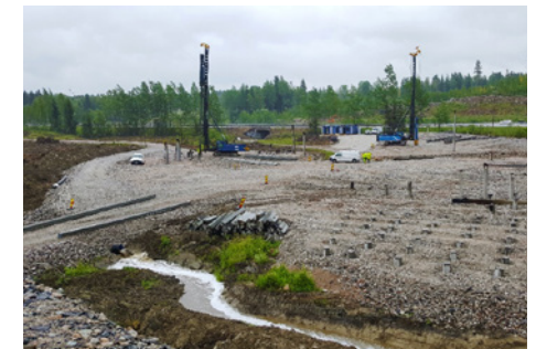
Paalutustyöt käynnissä Kujalassa.