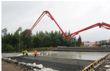
Launeen paalulaattoja valettiin vaihtelevassa kesäsäässä.