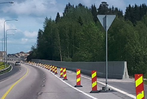
Hankeosan ensimmäinen meluste asennettu Soramäkeen.