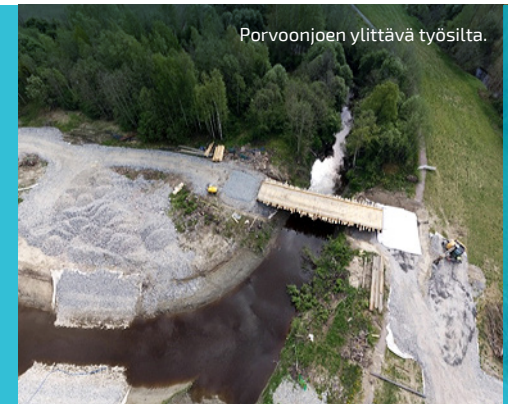
Porvoonjoen ylittävä työsilta.

Työnaikaisen sillan valmistuminen Porvoonjoen yli.