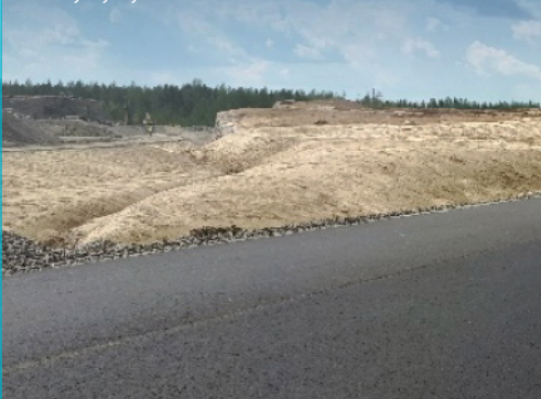
Päällystystyöt aloitettu Soramäessä.

VIIKON ONNISTUMISET: Päällystystyöt aloitettu suunnitellun aikataulun mukaisesti.