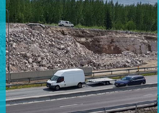
Louhintatyömaa valtatie 4 varrella

VIIKON ONNISTUMISET: Louhintatyöt sujuvat hyvin valtatie 4 varrella.