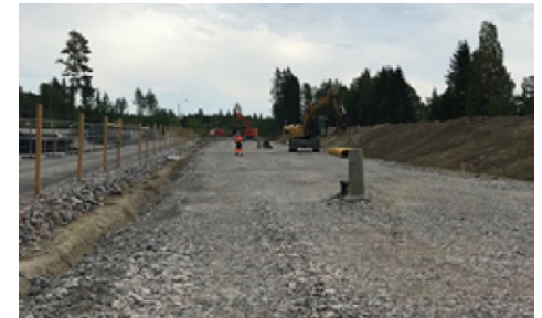
Orvokkitiellä tehtiin tien rakennekerroksia.