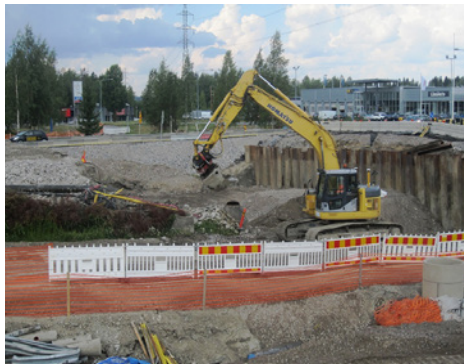
Kuvassa rakennetaan Aukeankadun alikulkukäytävän paalutus pohjia.