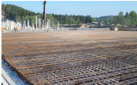
Kuvassa näkyy Luhdanjoen itäpuolella sijaitsevan paalulaatan raudoitusta sekä itse paalutusta.