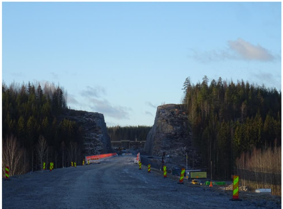
Kuva 2. Luhdanjoen silta, taustalla Patiokallio ja Patiokallion risteyssillan telinettä