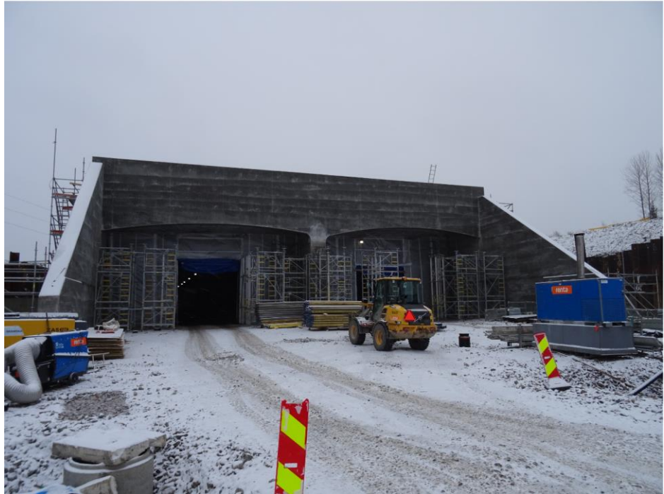
Kuva 4. Patomäen tunnelin länsipää.