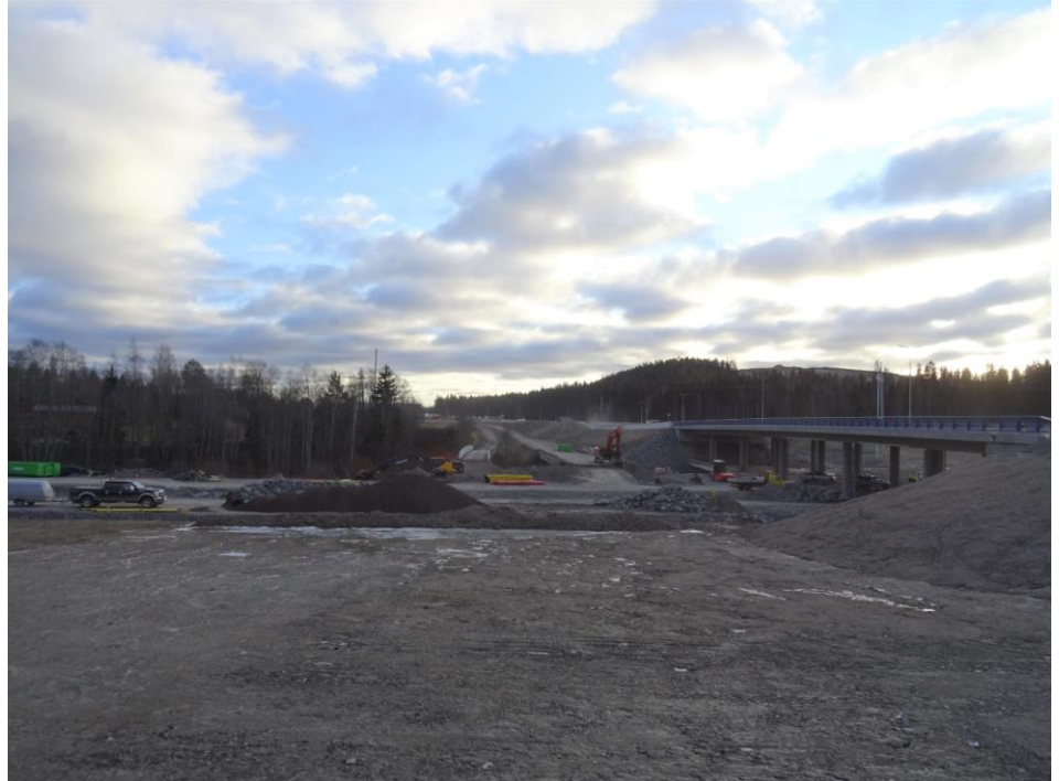
Kuva 1. Okeroisten eritasoliittymän aluetta, vanhan tielinjan purkua. Kuvassa purettavat Kosen sillat.