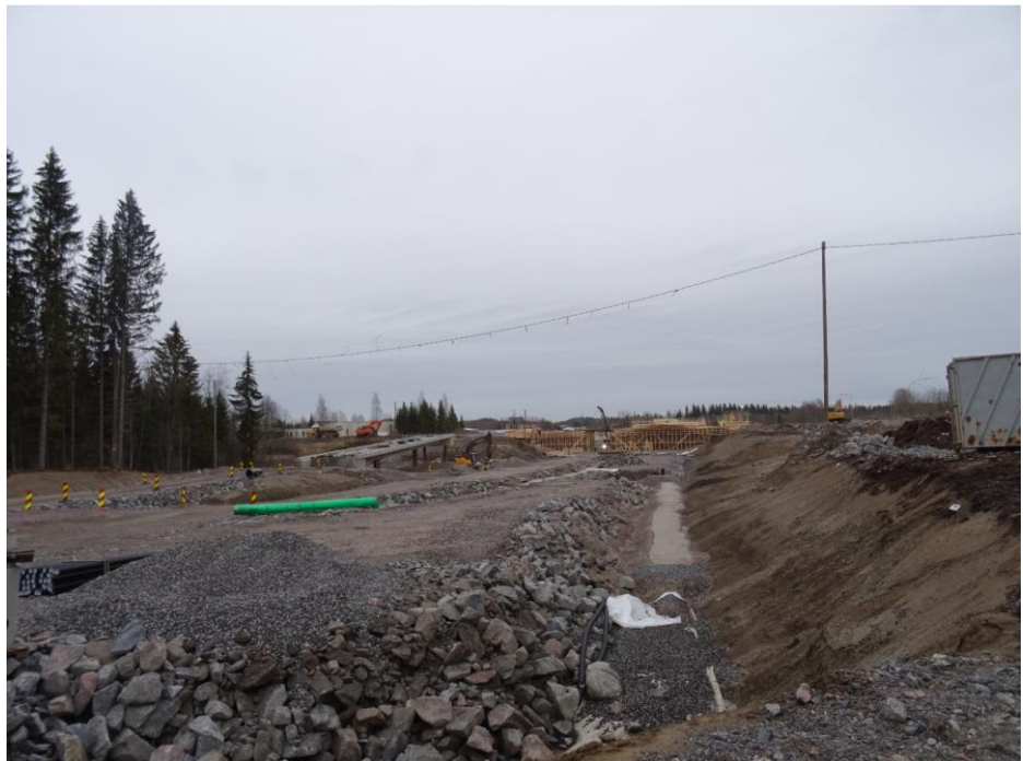
Kuva 3. Nikulan eritasoliittymän aluetta

Kujalan eritasoliittymässä liikenne soljuu avatuilla osuuksilla hyvin. Alueella on tehty vielä maisemointeja sekä vielä suljettuna olevilla rampeilla portaaliasennuksia.