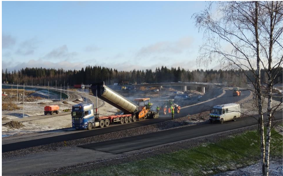
Kuva 3. Kujalan risteyssilta ja päällystystöitä Kujalassa

Kujalassa purettiin risteyssillan muotit yötöinä, valtatie 4 liikenne oli kiertotiellä eritasoliittymän ramppien kautta. Samalla moottoritietä poistettiin 4,4 metrin korkeusrajoittimet, ja tehtiin asfaltin jyrskintätöitä. Kujalassa on tehty myös mm. luiskien viimeistelyä, päällystystöitä, kaideasennuksia, kiveystöitä ja riista-aidan asennusta. Valtatiellä 4 sillankorjaukset ovat käynnissä kahdella sillalla.