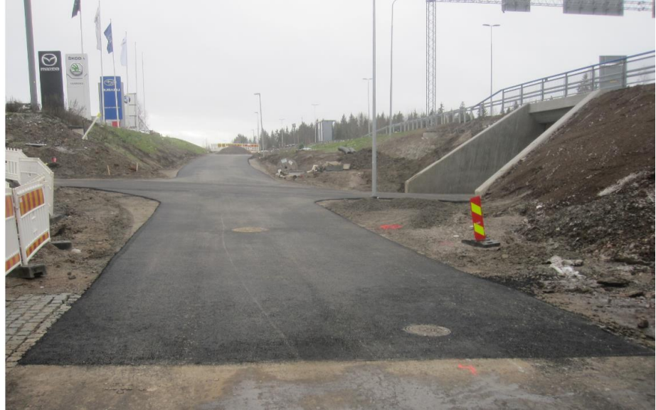
Kuva 6. Aukeankadun alikulkukäytävän jalankulun ja pyöräilyn väylä