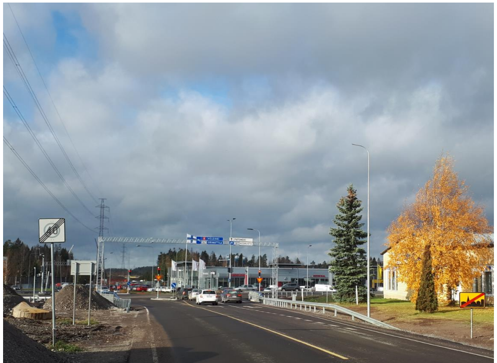
Kuva 5. Aukeankadun risteuksen portaalit saatiin asennettua.

Urakka on myöhässä valmistumisaikataulusta.