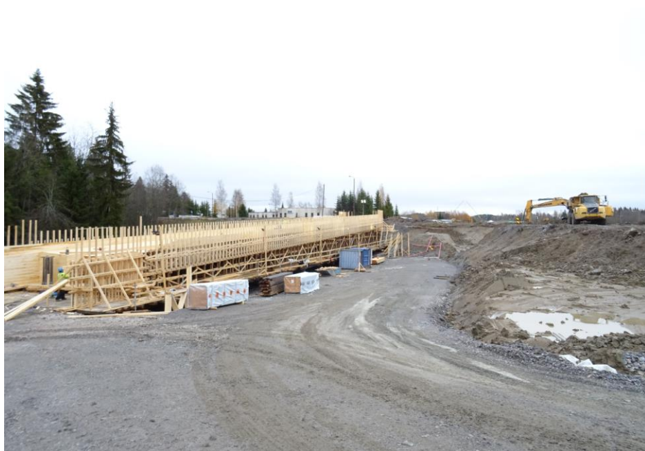
Kuva 4. Nikulan ramppisilta