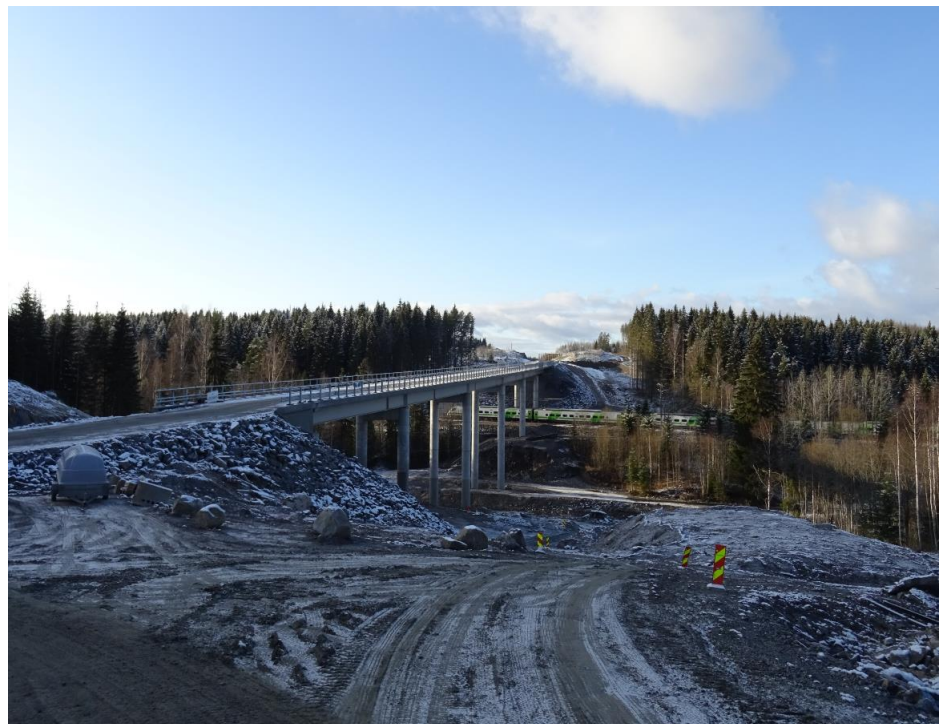
Kuva 1. Vähäjoen silta

Siltatyöt ovat edelleen käynnissä usealla sillalla: lokakuun aikana saatiin valmiiksi Nostavan risteyssillan teline, Tikkakallion risteyssillalla aloitettiin telineen rakentaminen, ja Patiokallion risteyssillalla tehtiin perustusrakenteita. Isoilla silloilla työt etenevät myös hyvin: Vähäjoen silta avattiin työmaakäyttöön, ja junaradan päälle asennettu suojakehikko purettiin tarpeettomana. Luhdanjoen sillalla saatiin muottien purku valmiiksi ja siirryttiin teräsrakenteen maalaustöihin ja kannen vesieristystöihin.