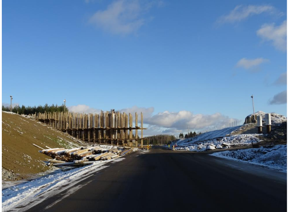
Kuva 2. Tikkakalliontien risteyssilta