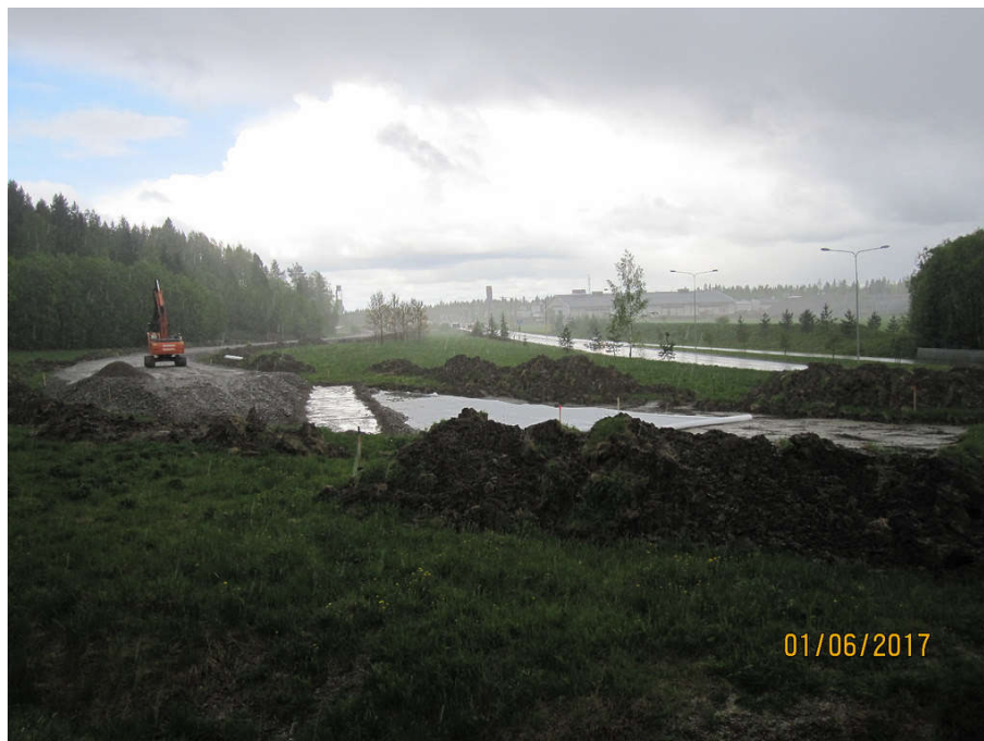
Kuva 1. Kiertotien rakentaminen Launeen ETL