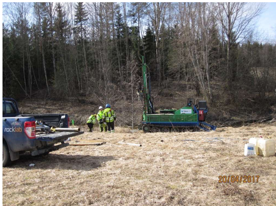
Kuva 1. Pohjatutkimuksia hankeosalla 1A

Urakkahankinta on käynnissä, hankintailmoitus on julkaistu 18.4.2017. Pohjatutkimukset ovat käynnissä.