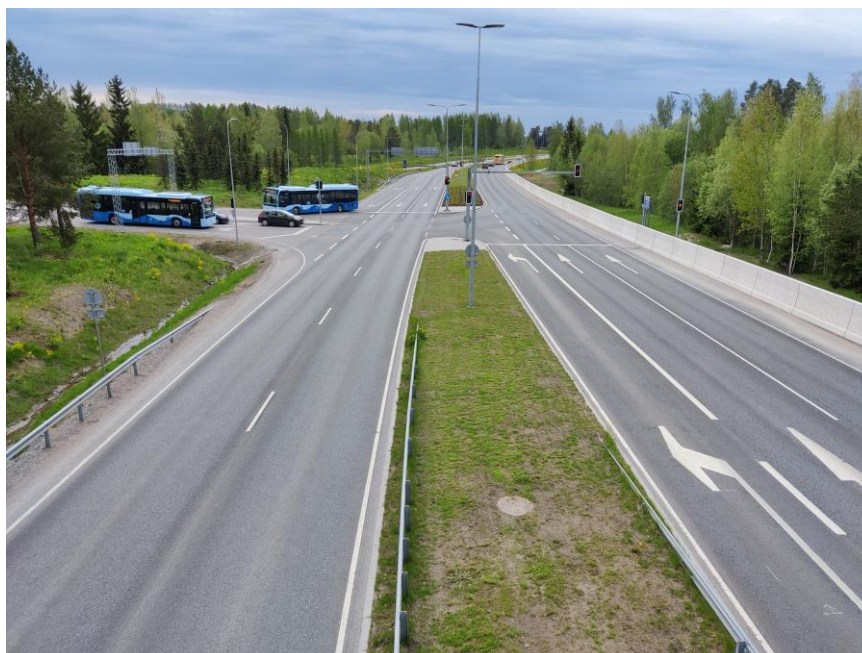
Kuva 4. Uudenmaankatu.

Kesällä 2021 tehdään jalankulun- ja pyöräilyväylien päällystyksiä sekä siltoihin liittyviä viimeistelyitä.