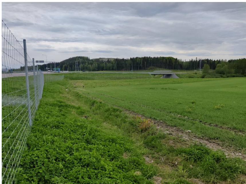
Kuva 3. Uutta riista-aitaa Okeroisissa.