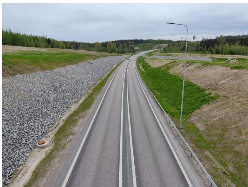
Kuva 1. Nostavan ETL.

Viimeistely- ja takuuajan töitä on aloitettu viikolla 21.