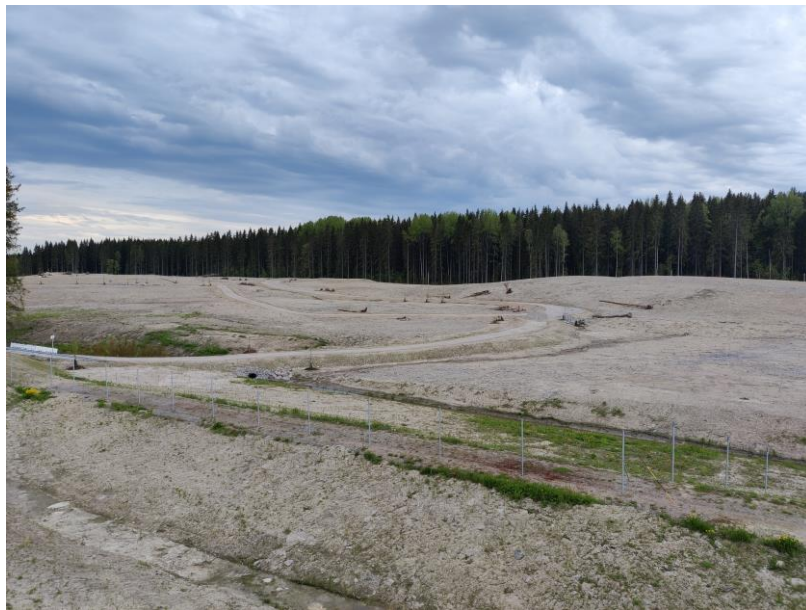
Kuva 2. Kujalan maa-ainesten sijoitusalue.

Patomäen kentän osalta työt aloitettiin viikolla 21 ja riista-aidan rakentaminen kehätielle on käynnissä. Tolpat on pääosin asennettu ja verkotustyöt on aloitettu Okeroinen-Nikula välillä.