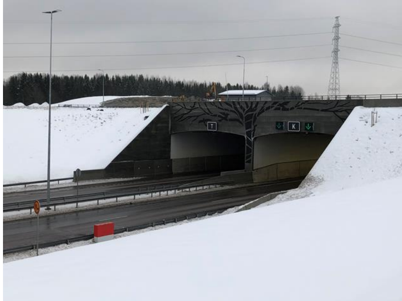
Kuva 1. Patomäen tunneli