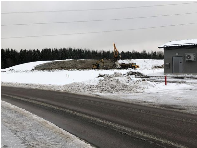
Kuva 2. Patomäki