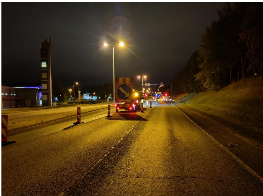
Kuva 4. Opasteiden asennus Hämeenlinnantiellä

Koko urakka-alueella on asennettu kaivutöitä vaativia opasteita sekä vaihdettu nykyisiin portaaleihin opasteita. Opasteista on asennettu noin 90 %.