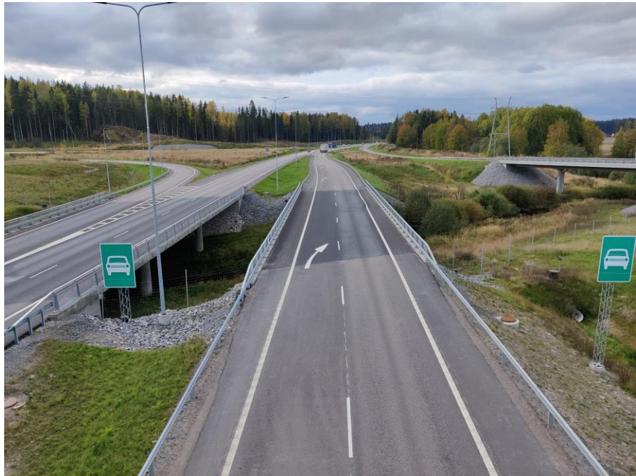
Kuva 1. Okeroisten ETL