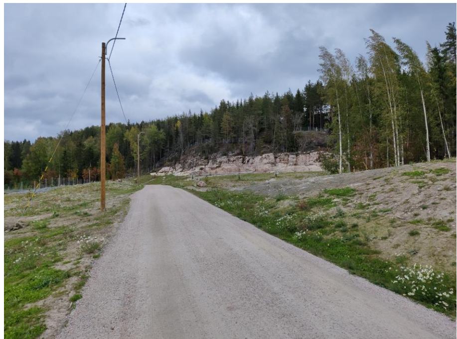
Kuva 2. Liipolan ulkoilureitti

Käynnissä on myös vihertöiden takuuajan hoito sekä siltojen viimeistelytöitä.