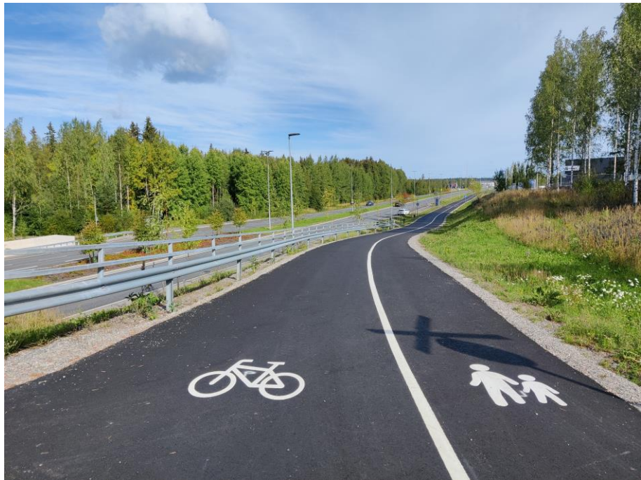
Kuva 3. Uudenmaankatu

Kesän 2021 aikana on tehty täydennysistutuksia, jalankulun- ja pyöräilyväylien päällystyksiä sekä siltoihin liittyviä viimeistelyitä.