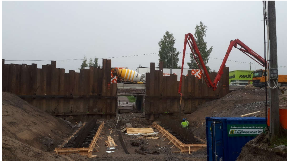
Kuva 1. S3 peruslaattojen valu