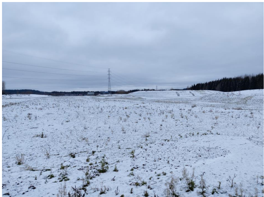
Kuva 2. Patomäki

Riista-aitaa on rakennettu Launeen meluvallin kohdalle ja varastoalueiden viimeistelytyöt ovat käynnissä.