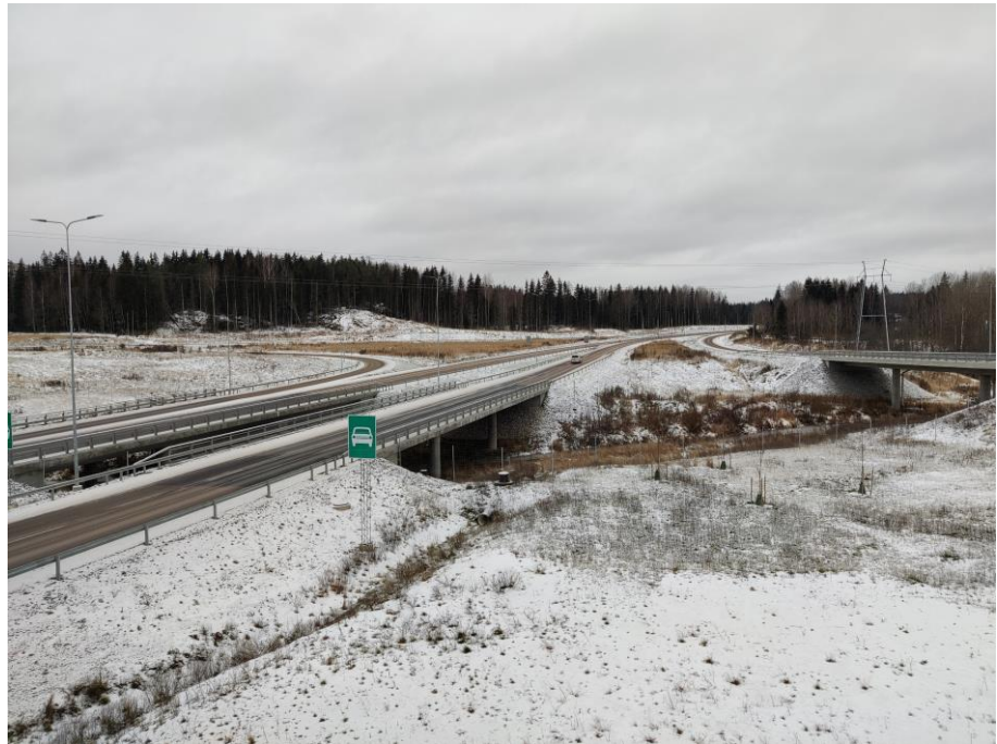
Kuva 1. Okeroisten ETL