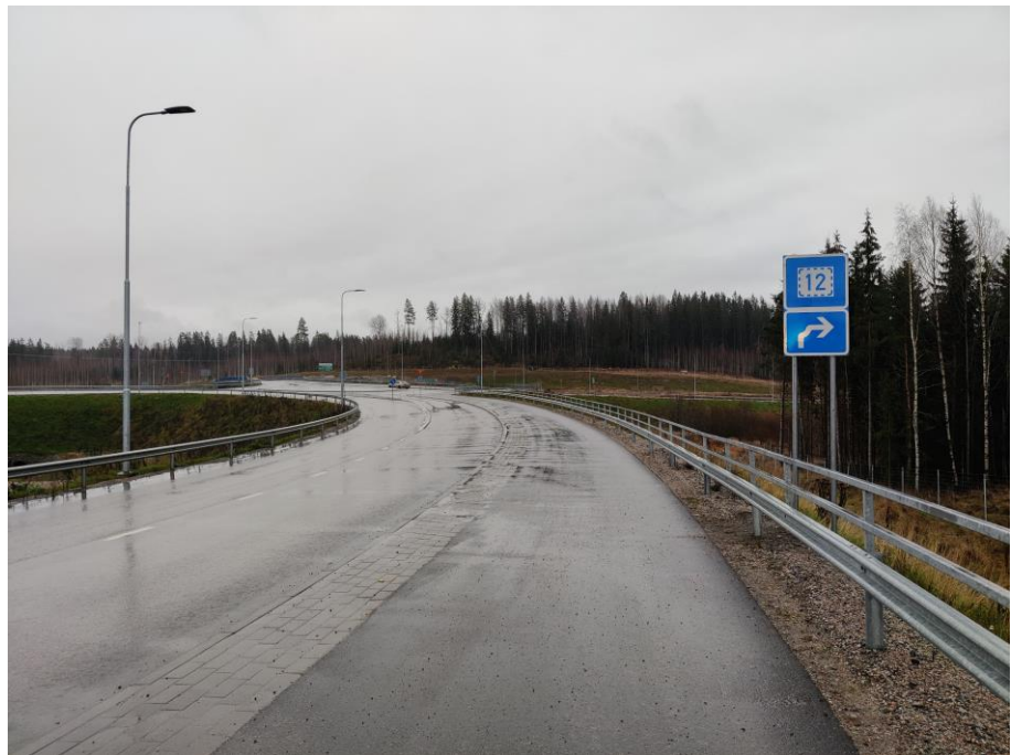
Kuva 3. Varareittiopaste Kujalassa.

Varareittiopastusta Okeroisten ETL:ssä ja Kujalan ETL:ssä on täydennetty.