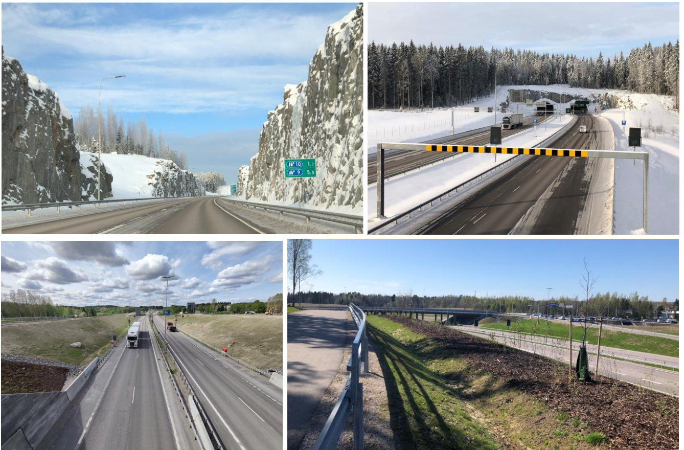
Kehätie 1v 8.12.2021 📍

Kuukausiraportti nro 11/2021 Tarkastelujakso: 1.11.2021 – 30.11.2021