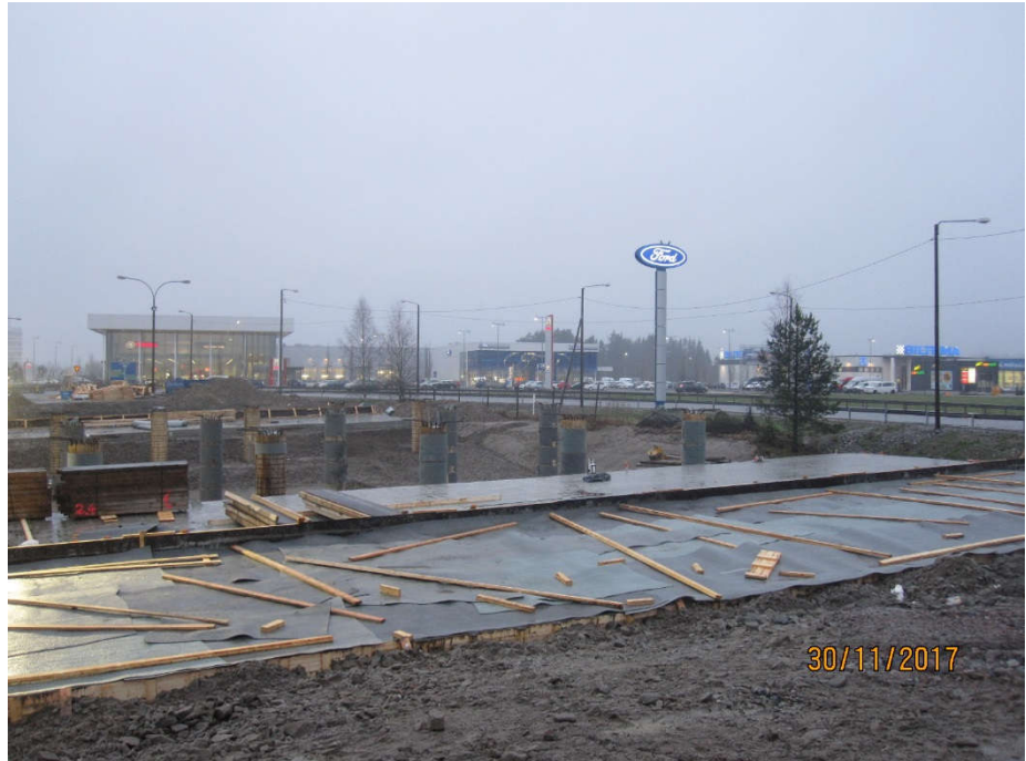
Kuva 1. Työt ovat käynnissä Hankaankadun risteyssillalla S1