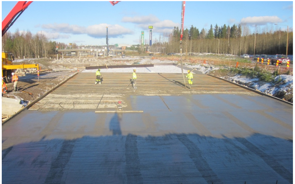
Kuva 1. Silta S24 paalulaatta

Ansiokatu/Patometsänkatu/Aukeankatu/Alavankatu käynnissä olevat vesi-huoltotyöt vaikuttavat liikennejärjestelyihin em. kaduilla sekä kevyen liikenteen väylillä.