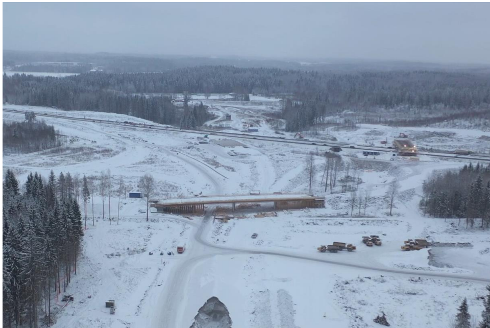
Kuva 4. Kujalan eritasoliittymä lännestä, etualalla Huovilanmäen risteysilta