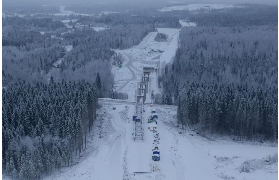
Kuva 1. Vähäjoen risteyssillan teräslohkot ja välituet lännestä katsottuna