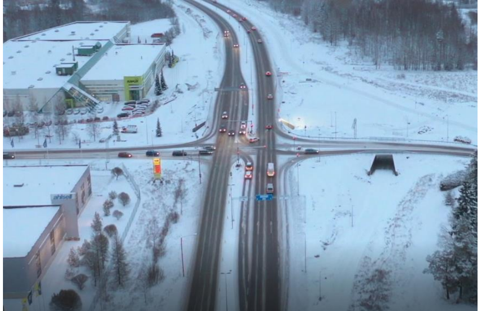
Kuva 5. Orimattilankadun risteyksessä liikennevalot ja Uudenmaankadun alittava Kangasmäen alikulkukäytävä käytössä.