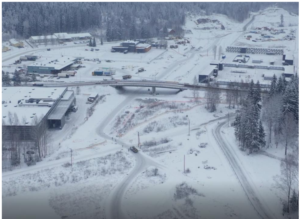
Kuva 3. Ajokadun risteyssilta päivää ennen avaamista liikenteelle

Nikulan eritasoliittymän alueella aloitettiin työt stabilointitöillä.