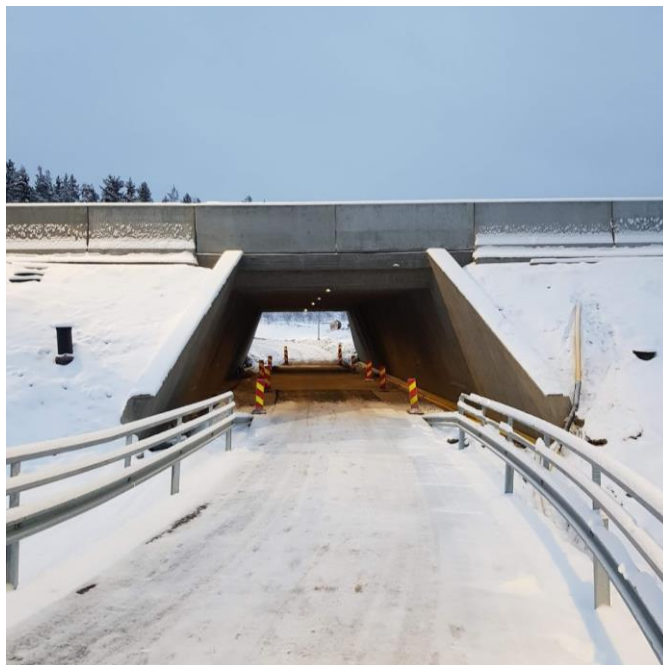
Kuva 6. Launeen alikulkukäytävä valmiina jalankulkua ja pyöräilyä varten.