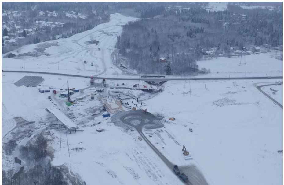
Kuva 2. Okeroisten eritasoliittymä lännestä päin