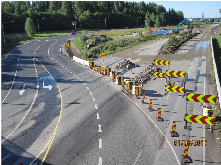
Kuva 1. Kiertotie 24 on otettu käyttöön

Rakennustyöt ovat käynnissä ja valmistuvat urakoitsijan ilmoituksen mukaan sopimuksen mukaisessa aikataulussa.