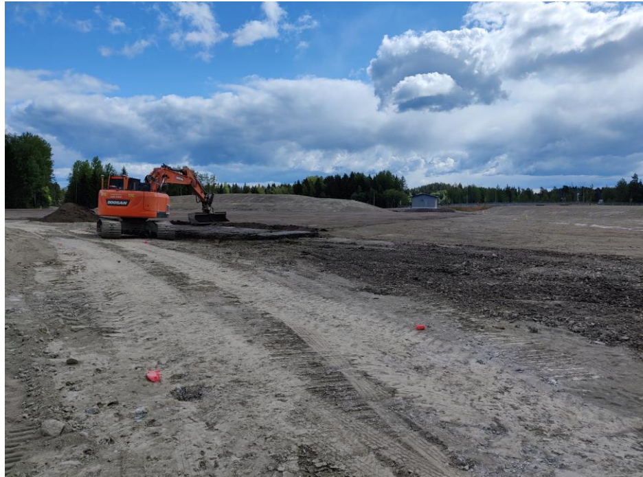
Kuva 2. Patomäki.

Käynnissä on myös vihertöiden takuuajan hoito sekä siltojen viimeistelytöitä.