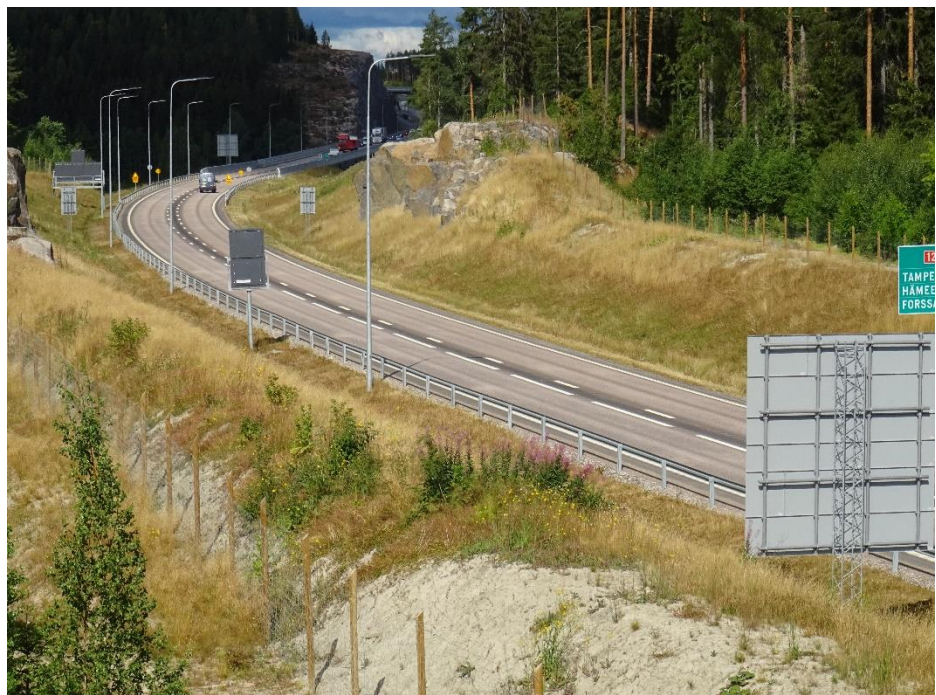
Kuva 1. Kehätie Lintulantien sillalta.

Viimeistelytyöt ja takuuajan työt ovat käynnissä.