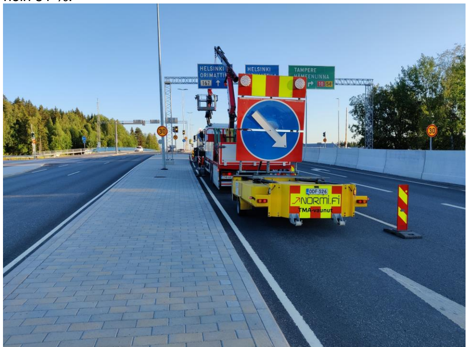
Kuva 4. Opasteasennus Uudenmaankadulla.

Mannerheiminkadulla sekä siihen liittyvillä kaduilla, Helsingintiellä ja Uudenmaankadulla on vaihdettu portaaliopasteita. Opasteista on asennettu noin 51 %.