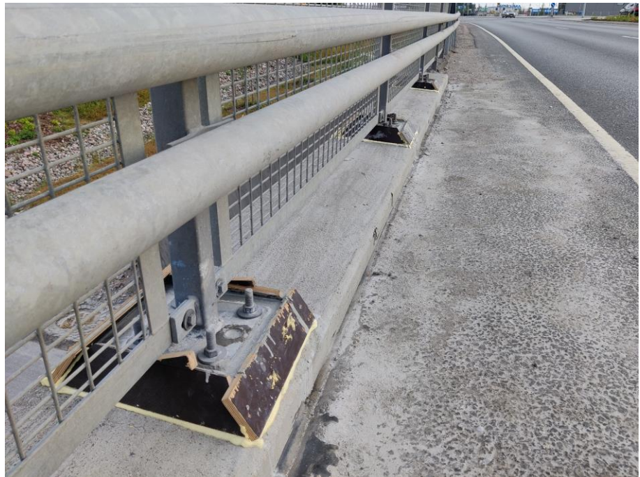
Kuva 3. Kyöstilän alikulkukäytävän viimeistelyt.

Kesän 2021 aikana tehdään täydennysistutuksia, jalankulun- ja pyöräilyväylien päällystyksiä sekä siltoihin liittyviä viimeistelyitä.