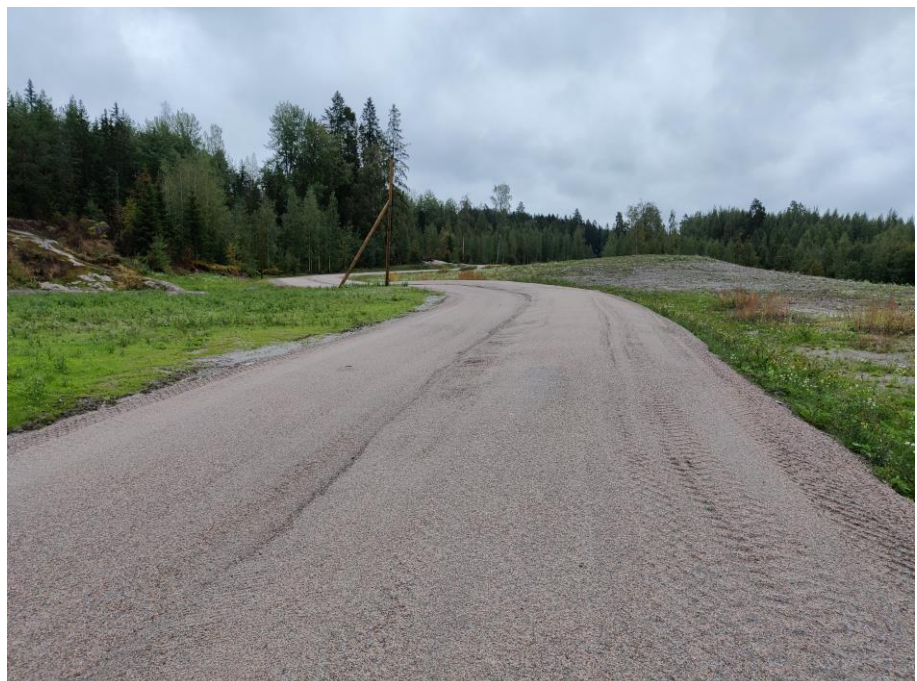
Kuva 2. Liipolan ulkoilureitti.

Käynnissä on myös vihertöiden takuuajan hoito sekä siltojen viimeistelyitä.