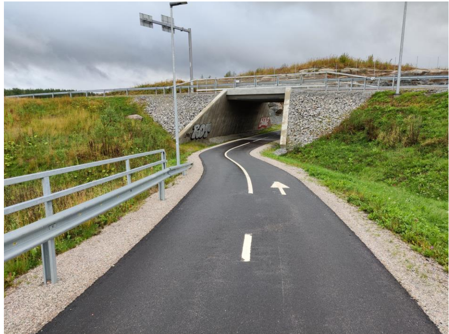
Kuva 1. Sorämäki, jalankulun ja pyöräilyn väylä.