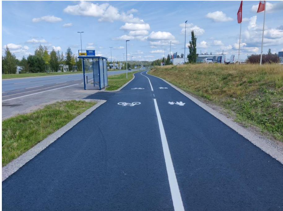
Kuva 3. Uudenmaakadun jalankulun ja pyöräilyn väylä.

Kesän 2021 aikana on tehty täydennysistutuksia, jalankulun- ja pyöräilyväylien päällystyksiä sekä siltoihin liittyviä viimeistelyitä.