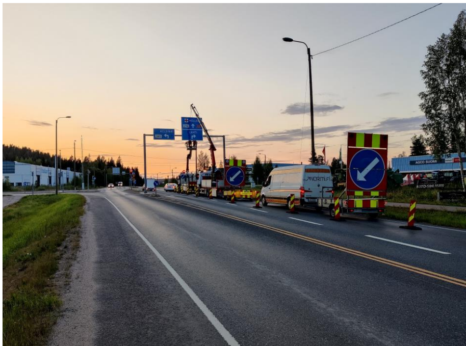
Kuva 4. Opasteasennus mt 140/mt 296.

Mannerheiminkadulla sekä siihen liittyvillä kaduilla, Hämeenlinnantielle, mt 296:lla ja Uudenmaankadulla on vaihdettu portaaliopasteita. Opasteista on asennettu noin 70 %.