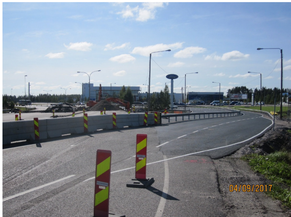
Kuva 1. Kiertotie K1