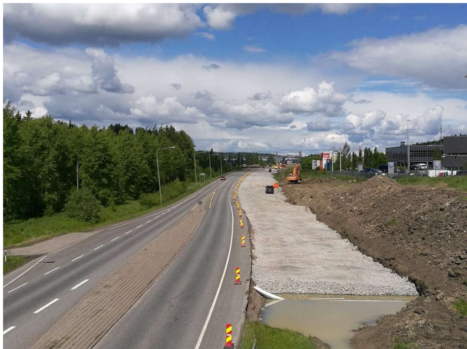
Kuva 1. Mt 167 itäpuolen ajoratalevitys 28.6.2017

Työt maastossa ovat käynnissä ja etenevät urakoitsijan mukaan suunnitellun aikataulun mukaisesti.