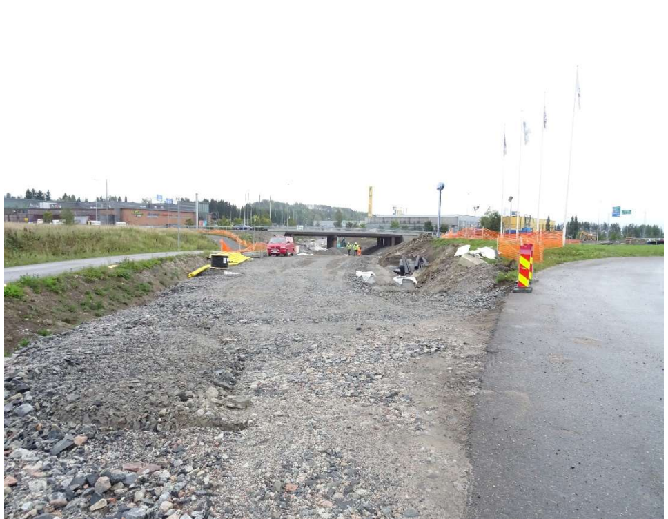
Kuva 5. Tuleva Hankaankatu.