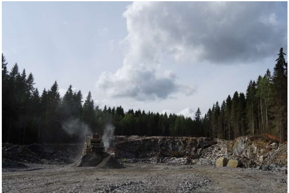
Kuva 3. Murskaus käynnissä Liipolan tunnelin itäisellä suuaukolla.

Elokuun alussa saatiin Launeen koulun vieressä uusi Orvokkitie aukaistua sopivasti ennen koulujen alkua.