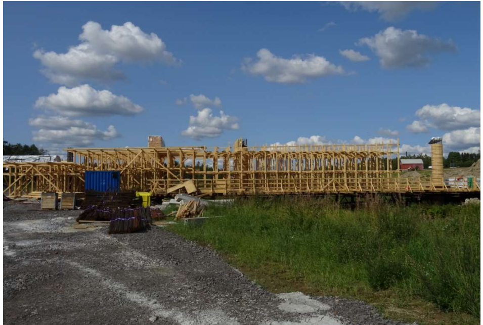
Kuva 1. Ala-Okeroisten sillan telinettä