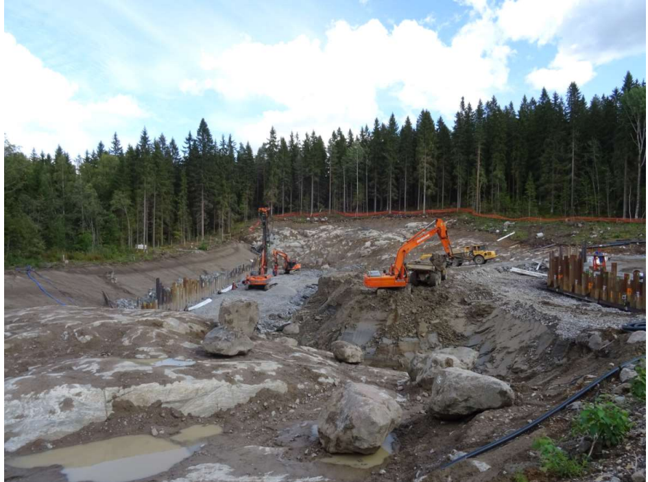
Kuva 4. Liipolan välitunnelin kaivantoa ja louhintatyöt alkamassa.