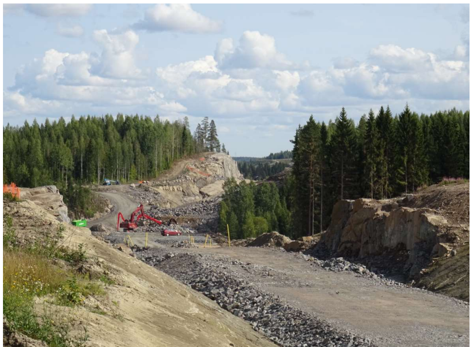
Kuva 2. Tielinjaa Tikkakalliolla Patiokalliolle päin.