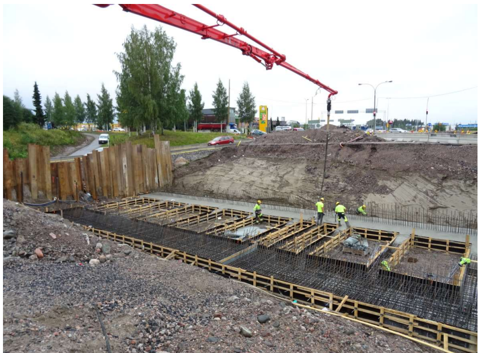
Kuva 6. Kyöstilän alikulkukäytävän perustusten valu käynnissä.