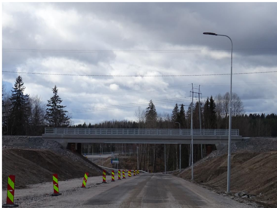
Kuva 4. Vanhanradankatu ja Lahti-Loviisa-junaradan alitus.