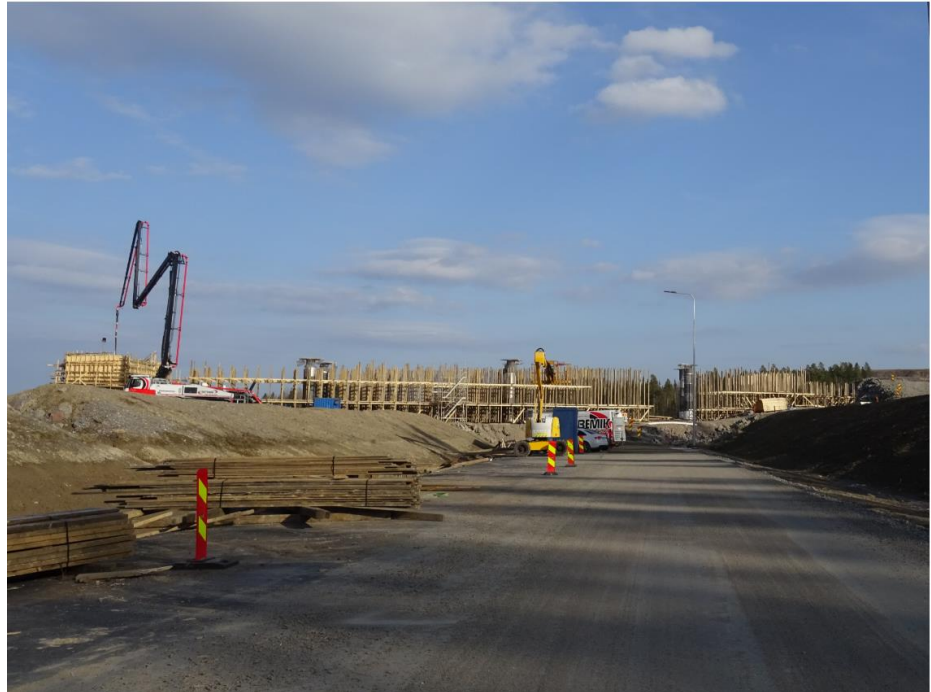
Kuva 1. Lintulantien risteysilta.