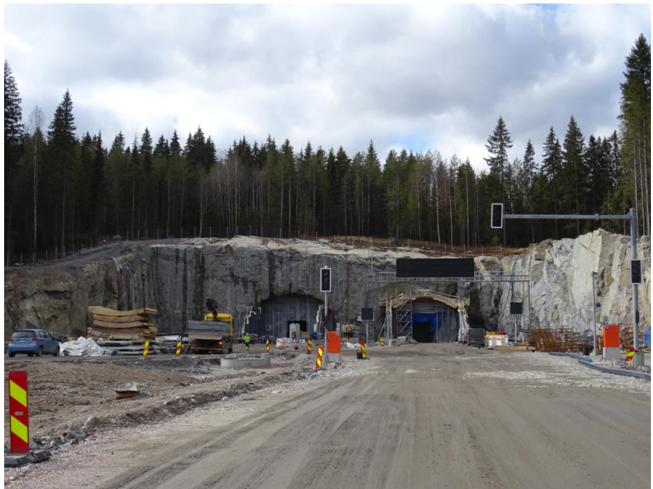
Kuva 3. Liipolan tunnelin itäinen suuaukko