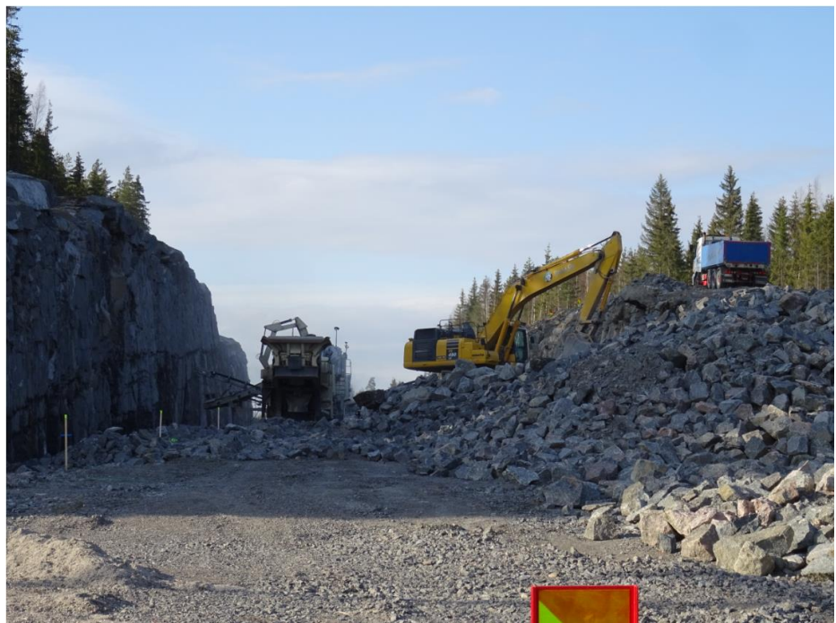
Kuva 2. Murskaustyöt Hirvikalliolla