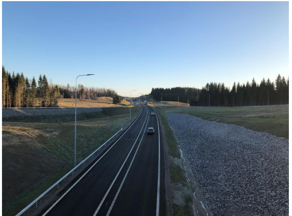
Kuva 2. Nostavan ETL