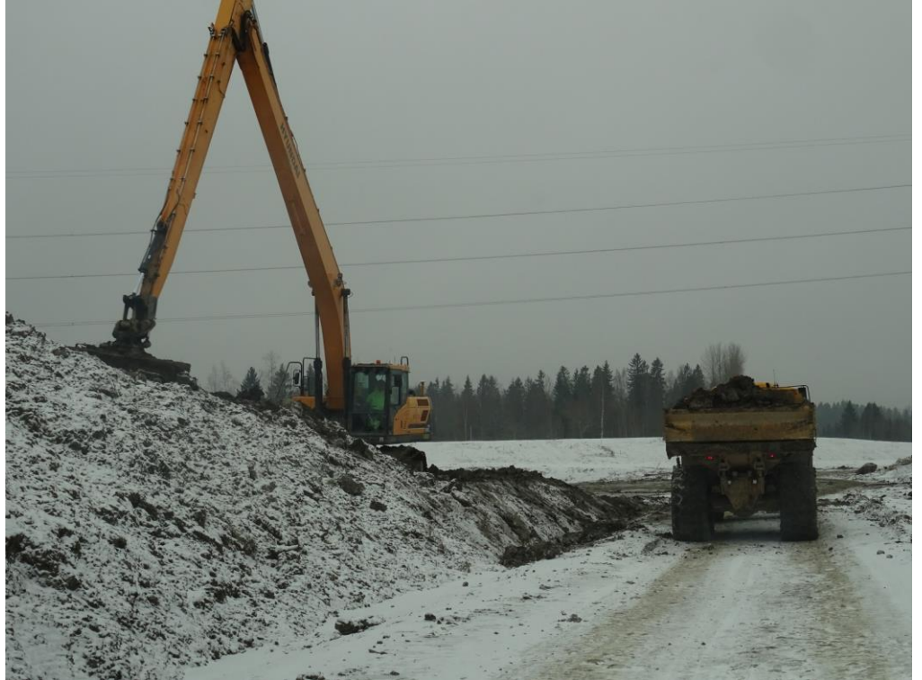
Kuva 3. Patomäki