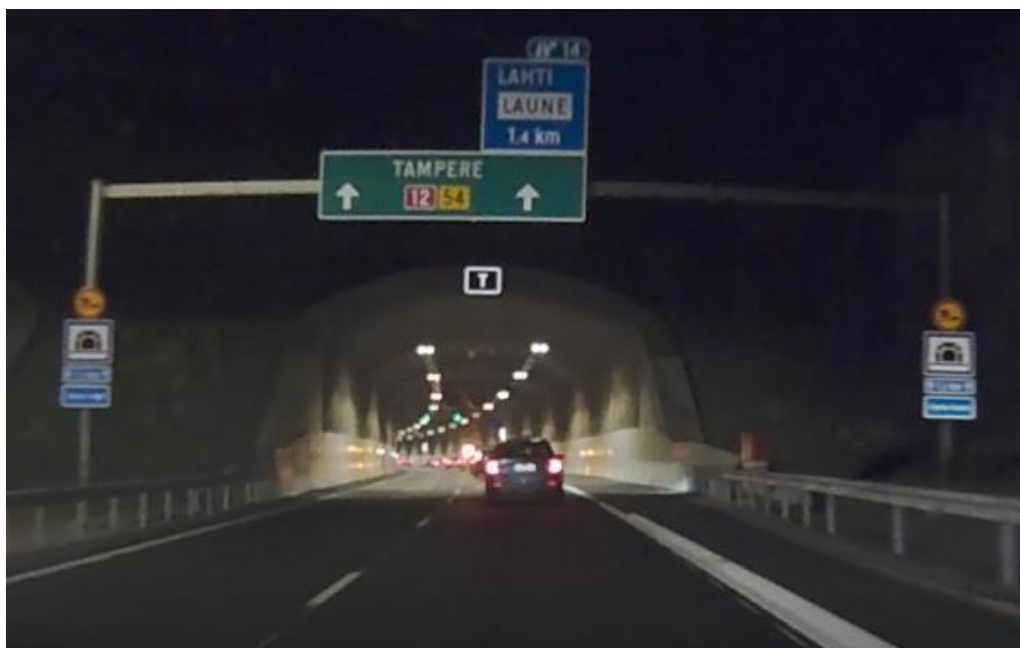
Kuva 1. Liikenteelle otto

Kehätie avattiin liikenteelle 8.12.2020. Avaaminen sujui hyvin ja turvallisesti saattoautojen avustuksella.