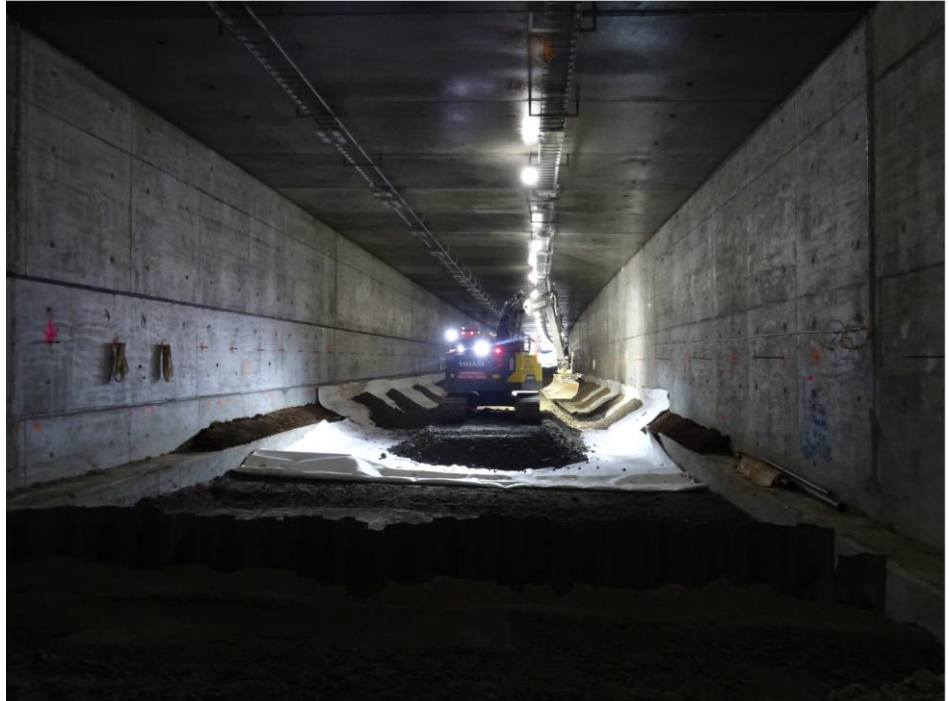
Kuva 4. Patomäen tunneli, pohjavedensuojaus.