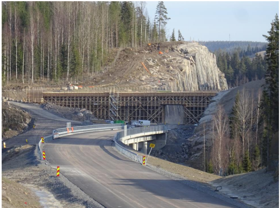
Kuva 2. Patiokallio ja Patiokallion risteysilta Tikkakallion risteysillalta katsottuna