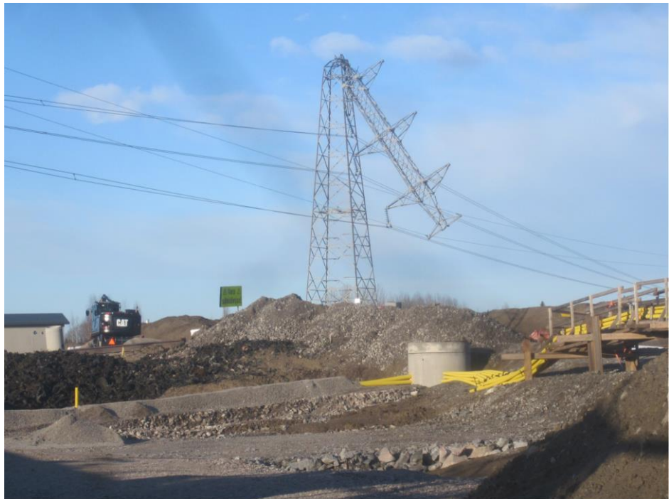
Kuva 3. Myrskyn katkaisema 110 kV pylväs Patomäessä

Liipolan kalliotunnelissa on jatkettu verhousrakenteen tekoa, asennettu reunaelementtejä, ja rakennettu yhdyskäytäviä sekä laitetilaa. Laitetiloissa ja yhdyskäytävillä tekniikan asennukset ovat käynnissä. Läntisellä suuaukolla, välitunnelilla ja itäisellä suuaukolla jatkettiin betonirakenteiden tekoa.