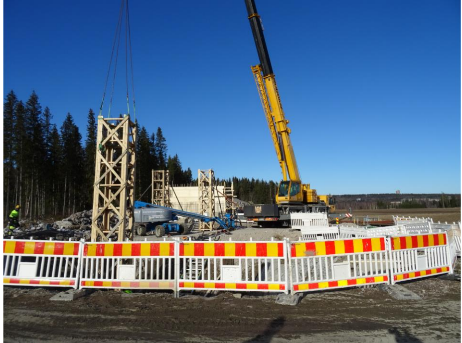
Kuva 1. Lintulantien risteysilta, pilarimuottien nosto.