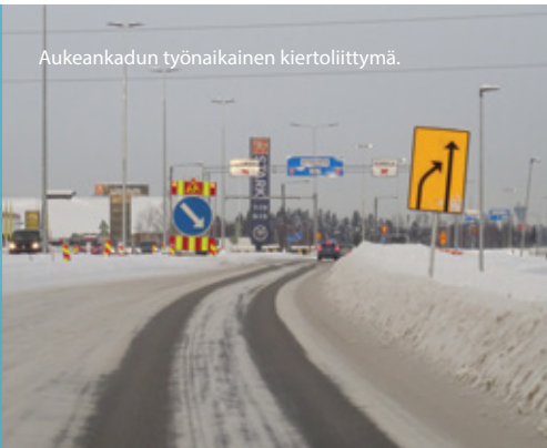
Aukeankadun työnaikainen kiertoliittymä.