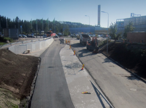
Hankaankatua ABC:n puolella.

VIIKON ONNISTUMISET: Hulevesipumppaamojen käyttöönotto.