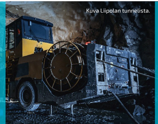
Kuva Liipolan tunnelista.