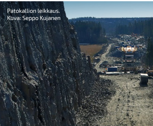
Pätökallion leikkaus.