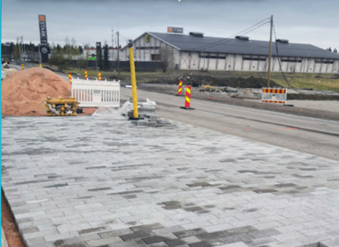
Keskisaarekkeen betonikiveystä Launeella.

VIIKON ONNISTUMISET: Aukeankadun alikulkukäytävän ensimmäinen osa saatiin eristettyä.