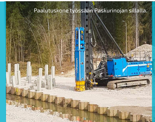
Paalutuskone työssä Paskurinojan sillalla.

VIIKON ONNISTUMISET: Paskurinojan sillan paalutus saatu käyntiin.