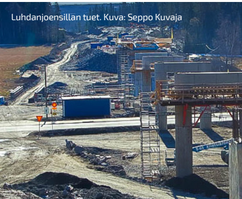
Luhdanjoensillan tuet.

VIIKON ONNISTUMISET: Betonimäärältään hankeosan toiseksi suurin sillankansi on valettu Soramäessä!