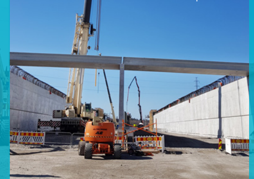
Ensimmäiset TT-laatat paikallaan.

TT-laattojen onnistuneet harjoitusnostot.