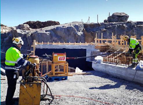
Jänneterästen asennusta Soramäen risteyssillalla.