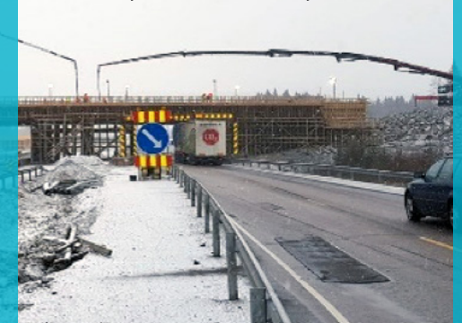
Lotilan risteysillan kannen valu käynnissä.

VIIKON ONNISTUMISET: Lotilan risteysillan kannen valu.